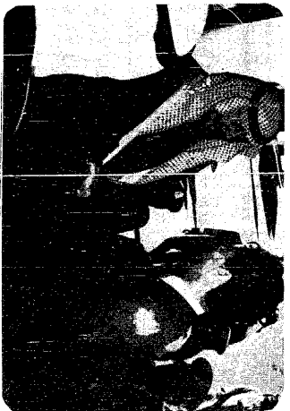
عندما التقى سموه بالربيعي معمر القذافي