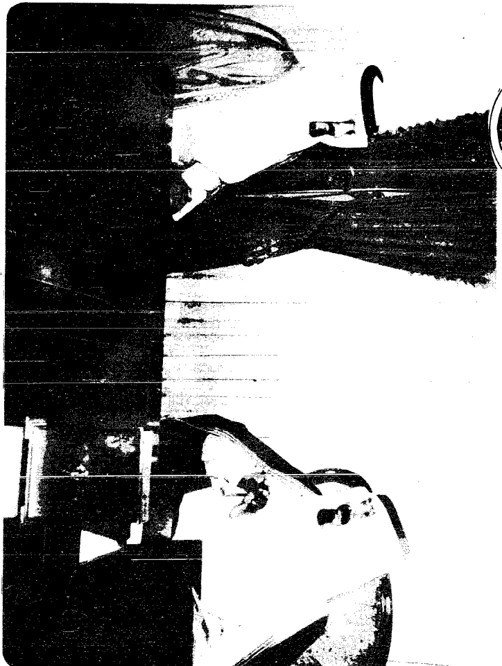
سمو الامير عبد الله رئيس التحرير الفلسطينية .. ليست بعيدا عن الوطنية لحفظ استقلال لبنان