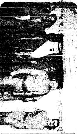
عندما التقى سموه بالربيعي معمر القذافي