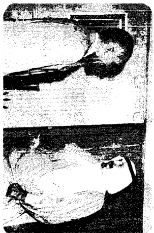
ترحب متبال بين سموه .. والحسين صدام حسين يستقبل سموه في بغداد