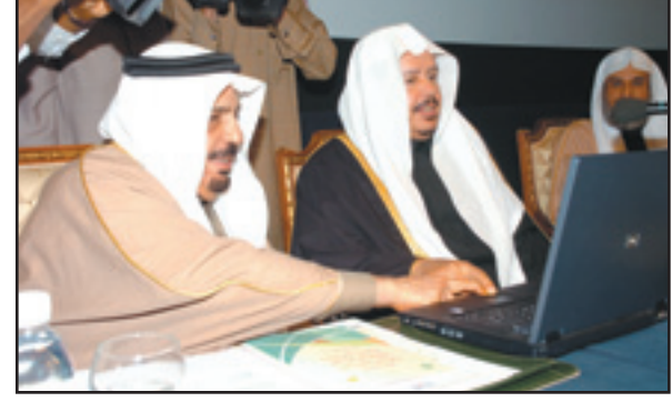
تشدين الموقع الإلكتروني للاستراتيجية

التطوير. وقال له الرياض، ان الاهتمام بتطوير القضاء يأتي ضمن أولويات خادم الحرمين الشريفين الملك عبدالله بن عبدالعزيز - حفظه الله - راعي مسيرة العدل في هذه البلاد واهتمام القيادة الكريمة بأكملها لتطوير هذا المرفق بشكل مستمر.