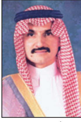
الأمير الوليد بن طلال

تبرع صاحب السمو الملكي الأمير الوليد بن طلال بن عبدالعزيز، رئيس مجلس إدارة مؤسسة الوليد بن طلال الخيرية لقرية عنم بمنطقة عسير بمولد للطاقة الكهربائية. وجاء تبرع سموه استجابة لطلب أهالي القرية وتم تسليم المولد للسيد عايض بن مانع سالم آل خميسة. وتقع قرية عنم بمحافظة تبليخ التابعة لمنطقة عسير، ويبلغ عدد المنازل التي ستستفيد من تبرع سمو الأمير الوليد ٤٠ منزلاً. وبإبصال الكهرباء لهذه القرية تكون مؤسسة الوليد بن طلال الخيرية قد أتمت إيصال التيار الكهربائي لأكثر من ٣٠٠٠ بيت وحسب آخر إحصائية في ٣٣٤ قرية وهجرة في مناطق مختلفة من المملكة حيث حظيت عدة مناطق وهجر متفرقة على مساهمات عدة من قبل سمو الأمير الوليد شملت تقديم مولدات كهرباء. وتكف مؤسسة الوليد بن طلال الخيرية، المكونة من فريق عمل يشمل عدداً من