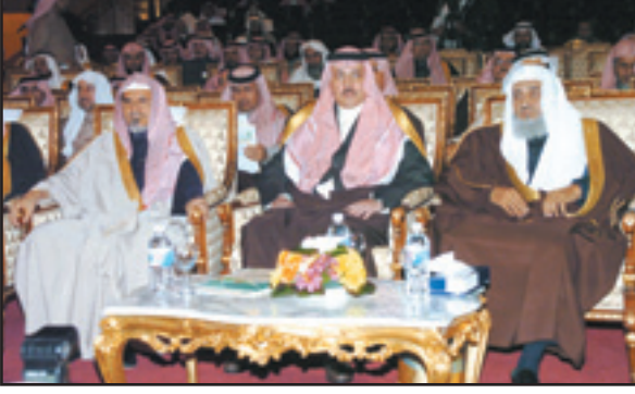
الأمير عبدالعزيز بن سمام، د. الحميد والشيخ الأمين

اليحيى: فريق من الخبراء والمختصين في كافة المجالات لتنفيذ أنشطة المشروع