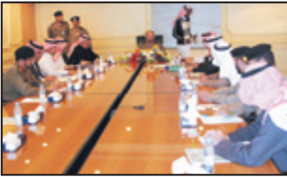
اللواء الحارثي ومسؤولو الشؤون الاجتماعية خلال اللقاء

الرياض - نايف آل زاحم: إنفاذاً لتوجيهات صاحب السمو الملكي الأمير نسايف بن عبدالعزيز وزير الداخلية والمتضمنة تأييد سموه الكريم لاقتراح وزير الشؤون الاجتماعية الدكتور يوسف العثيمين بشأن تبال وتبائل وجهات النخيل حول الخدمات المقترحة من وزارة الشؤون الاجتماعية لفئات المستحقين للمعاشات الدائمة والمساعدات المقطوعة لأسر السجناء، استقبل مدير عام السجون اللواء الدكتور علي بن حسين الحارثي مؤخراً كلاً من اللواء عثمان بن ناصر المحرج مدير عام مكافحة المخدرات والأستاذ محمد بن عبدالله العقلا وكيل وزارة الشؤون الاجتماعية للضمان الاجتماعي والإسكان الشعبي وعدد