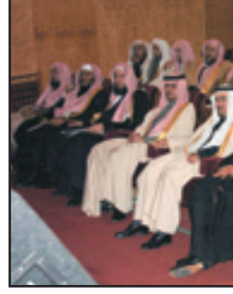
جانب من حضور الحفل

وأضاف ان وزارة العدل ستطبق الخطة الاستراتيجية لتطوير مرفق القضاء على مدى عشرين عاماً ابتداءً من العام الحالي ١٤٣٠ هـ.