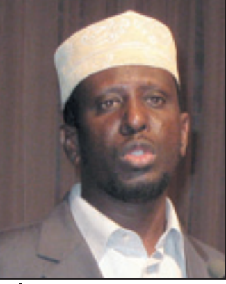
الشيخ شريف شيخ ريس الصومال الجديد

وانتخب الرئيس الجديد بعد رحيل الرئيس عبد الله يوسف احمد الذي دفع الى الاستقالة في نهاية كانون الاول/ديسمبر.