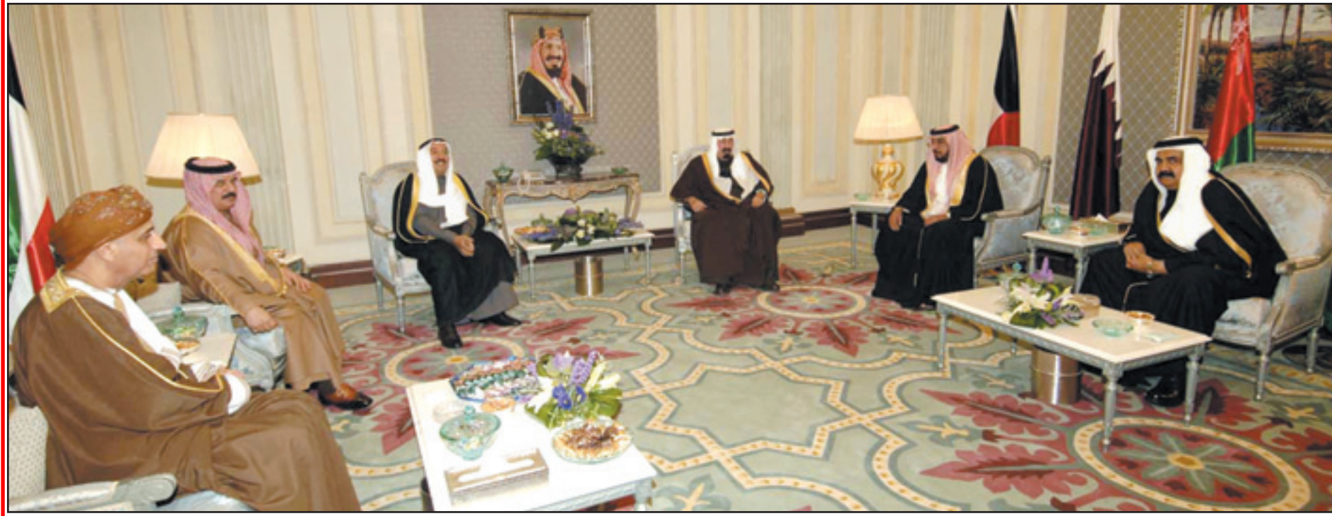
لقاء قادة دول التعاون في القمة الطارئة بالرياض (و.أ.س)