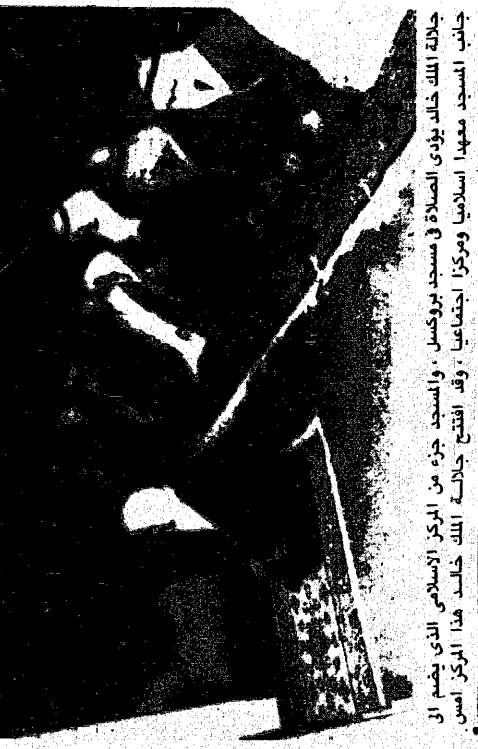
جلالة الملك خالد يؤدي الصلاة في مسجد بروكسل، وامسجد جزء من المركز الاسلامي الذي يضم ال جانب المسجد معها اسلمايا ومركزا اجتماعيا، وقد افتتح جلاله الملك خالد هذا المركز امس