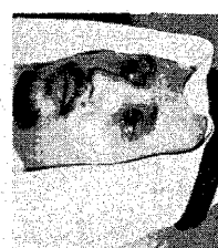
عقده يطلي إذا أذاعه مناهضة للحكم في عدن

أكد شيخ الإسلام ابن تيمية على أن الإسلام نظام متكامل يغني عن أي أيديوولوجية أخرى، وذلك لأنه يحدد العلاقة بين الفرد والمجتمع، وبين الحاكم والمحكوم، ويضع قواعد واضحة للسلوك في كل من هذه المجالات.