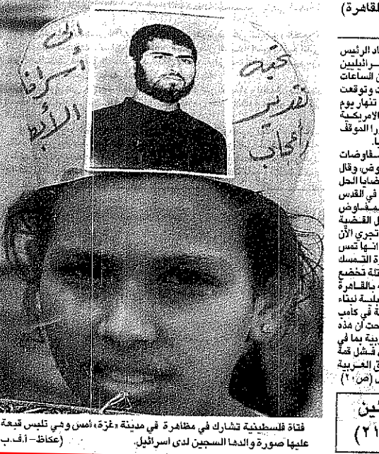
فئة فلسطينية تشارك في مظاهرة في مدينة غزة، اسس ولي تليس قبعة عليها صورة والدها السجين لدى اسرائيل.