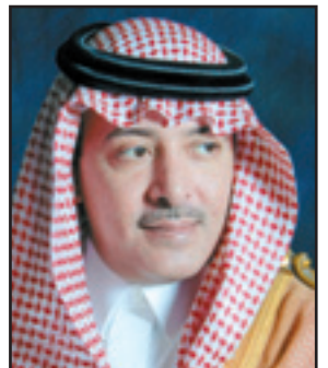
الأمير فيصل بن عبدالله

الرياض - (و.أ.س): تلقى صاحب السمو الملكي الأمير فيصل بن عبدالله بن عبدالعزيز رئيس هيئة الهلال الأحمر السعودي والتقدير من مدير عام حرس الحدود الفريق ركن طلال بن محسن العقراوي على ما يقوم به ويبدله رجال الهلال الأحمر السعودي في تقديم الخدمات الطبية الإسعافية لمنسوبي القطاعات الأمنية وقاطني المناطق الحدودية في جميع أنحاء المملكة العربية السعودية جنباً الى جنب مع اخواتهم حرس الحدود. جاء ذلك في برفقة لسموه من مدير عام حرس الحدود. فيما أكد صاحب السمو الملكي الامير فيصل بن عبدالله في