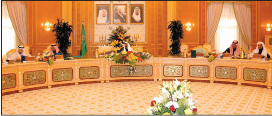
خادم الحرمين مترأساً جلسة مجلس الوزراء

رابعاً: قرر مجلس الوزراء الموافقة على اشتراك هيئة تنظيم الكهرباء والإنتاج المزدوج في عضوية الجمعية الإقليمية لمنظفي الطاقة لوسط أوروبا وشرقها، وذلك وفقاً لميثاق تأسيسها.