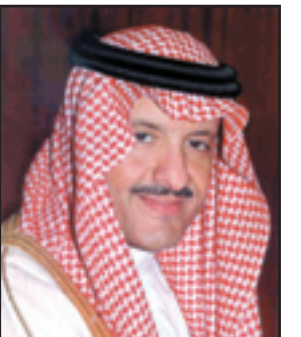
الأمير سلطان بن سلمان

الرياض - (الرياض): رفع صاحب السمو الملكي الأمير سلطان بن سلمان بن عبدالعزيز رئيس الهيئة العامة للآثار والسياحة ورئيس مؤسسة التراث أسمى آيات الشكر والعرفان إلى مقام خادم الحرمين الشريفين الملك عبدالله بن عبدالعزيز - حفظه الله - على رعايته ودعمه للعناية بالتراث والمحافظة عليه، مشيراً إلى تكلفه في هذا الإطار بتكاليف إعادة ترميم مسجد الشافعي والمعمر في جدة، مما يعد استمراراً لجهود - حفظه الله - في المحافظة على التراث الوطني، والتي تمثل نموذجاً علمياً يستحق الاقتداء، اعتداً وفق ما يراثنا الحضاري. كما أشاد سموه بدعم صاحب السمو الملكي الأمير سلطان بن عبدالعزيز ولي العهد نائب رئيس مجلس الوزراء وزير الدفاع والطيران والمفتش العام - حفظه الله - لرعايته انطلاقة البرنامج الوطني للمساجد العتيقة، منوهاً بما يجده هذا البرنامج من دعم كبير من سموه.