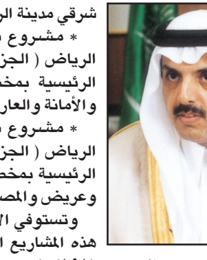
الأمير عبدالعزيز بن عياف

الرياض - (و.أ.س): وجه سمو أمين منطقة الرياض الدكتور عبدالعزيز بن محمد بن عياف الجهات المختصة في الأمانة بالإعداد للبدء في أقرب وقت ممكن في تنفيذ مشاريع جديدة تخصص لسفلتة أهم الشوارع الرئيسية والضرورية لتسهيل إيصال المرافق العامة والخدمات المختلفة إلى هذه المخططات، وتمكين المواطنين من اعمار وأزدهارها. ويأتي هذا التوجيه في إطار البرنامج الذي بدأته أمانة منطقة الرياض في الأونة الأخيرة لتطوير مناطق المنح ومخططاتها في مختلف أنحاء مدينة الرياض، وتعزيز عوامل نموها وزدهارها.