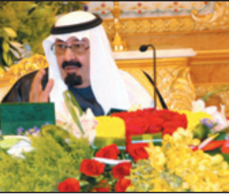
خادم الحرمين مترأساً جلسة مجلس الوزراء (واس)

بعث خادم الحرمين الشريفين الملك عبدالله بن عبدالعزيز آل سعود برفقة تهنئة لفخامة الرئيس جورجي بارفانوف رئيس جمهورية بلغاريا بمناسبة ذكرى يوم تحرير بلاده. وأعرب خادم الحرمين الشريفين باسمه وإسم شعب وحوكمة المملكة العربية السعودية عن أصدق التهاني، وأطيب التمنيات بالصحة والسعادة لفخامته، ولشعب بلغاريا الصديق أطراف التقدم والإزدهار. كما بعث صاحب السمو الملكي الأمير سلطان بن عبدالعزيز آل سعود ولي العهد نائب رئيس مجلس الوزراء وزير الدفاع والطيران والمفتش العام برفقة تهنئة لفخامة الرئيس جورجي بارفانوف رئيس جمهورية بلغاريا بمناسبة ذكرى يوم تحرير بلاده.