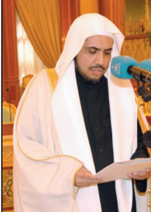
د. العيسى خلال أدائه القسم

هذا الإطار أن ما يقدمه رجال هيئة الهلال الأحمر السعودي من خدمات إسعافية إنسانية لمحتاجيها إنما هو من صميم الواجب الخاط بهم مبدياً الشكر للفريق الركن العقراوي على ما ابداه من مشاعر طيبة في هذا الشأن.