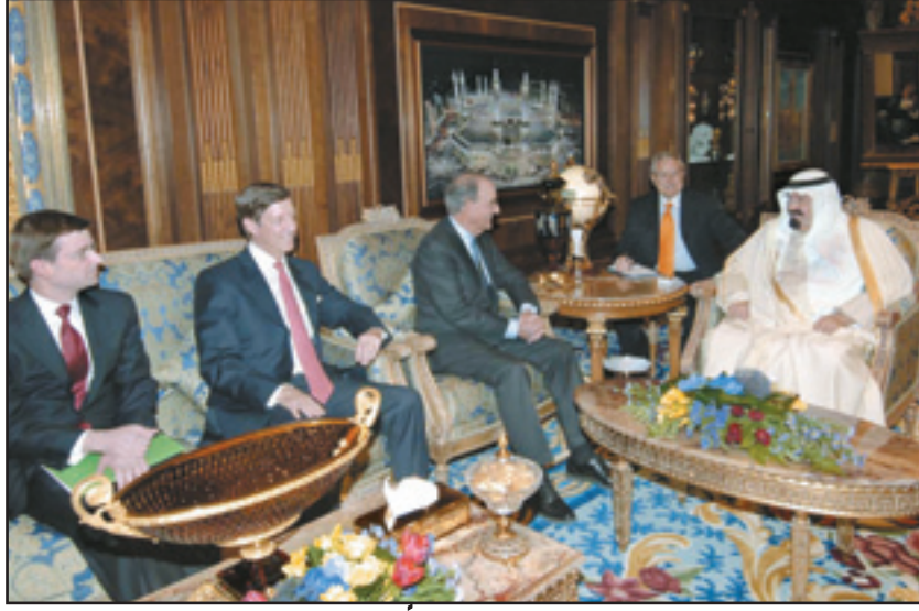
خادم الحرمين مستقبلاً ميتشل