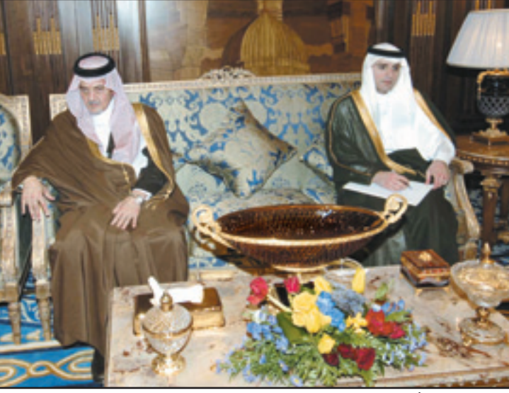
الأمير سعود الفيصل والسفير عادل الجبير خلال حضورهما الاستقبال