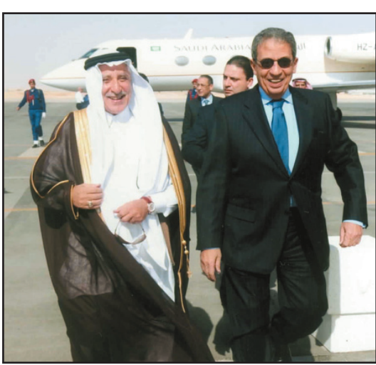
عمرو موسى لدى وصوله الرياض

من جانبه أكد المشرف العام على المعرض الدكتور محمد بن عبد الرحمن الفوزان أن «ابتكار ٢٠١٠م» سيكمل ما بدأه معرض ابتكار ٢٠٠٨م فيما يتعلق بإبراز المقدرة الوطنية في الابتكار والاختراع، وعرض الاختراعات والابتكارات الخاصة بالأفراد والجامعات والمؤسسات البحثية والحكومية وشركات القطاع الخاص، وترسيخ ثقافة الاختراع والابتكار والتأكيد على دور وسائل الإعلام في نشر هذه الثقافة وإشاعة مناخ الموهبة والإبداع والابتكار