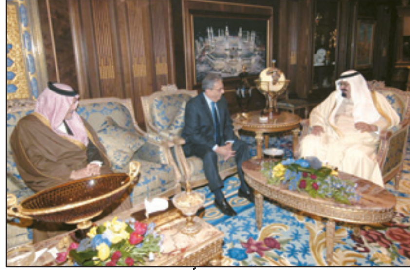
خادم الحرمين مستقبلاً عمرو موسى