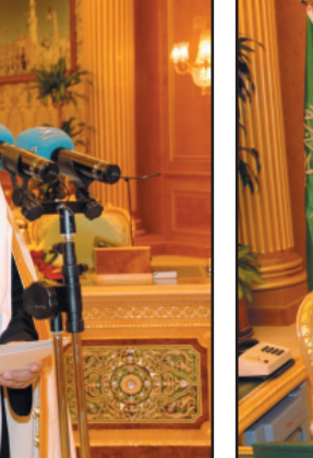
خادم الحرمين يصافح وزير العدل بعد أدائه القسم