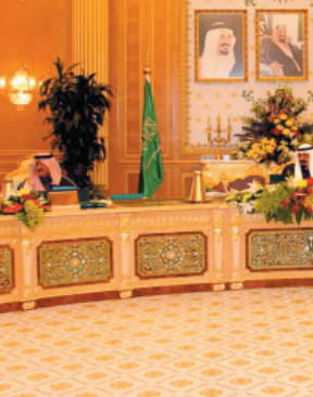
خادم الحرمين مترأساً جلسة مجلس الوزراء

ومبعوثيهم ومنها الرسائل التي تلقاها الملك المفدى من أخويه فخامة الرئيس بشار الأسد رئيس الجمهورية العربية السورية وصاحب السمو الشيخ صباح الأحمد الجابر الصباح أمير دولة الكويت وتركت تلك المشاورات حول تطورات الأحداث ومستجداتها في المنطقة والعالم والعلاقات العربية والشمل العربي. وبين معاليه أن المجلس ضمن الضمانين الشاملة لرسالة خادم الحرمين الشريفين الملك عبدالله بن عبدالعزيز أخيه فخامة الرئيس محمد حسني مبارك رئيس جمهورية مصر العربية بمناسبة الإنجاز الذي حققته جمهورية مصر العربية مع الإشتقاء في السلطة الفلسطينية والإخوة في حماس والفصائل الفلسطينية نحو الحل والصالحه لما فيه الخير بإذن الله للإشتقاء في فلسطين ولأمة العربية والإسلامية. وتمن المجلس انعقاد المؤتمر الدولي لإعادة إعمار غزة في جمهورية مصر العربية بدعوة كريمة من فخامة الرئيس محمد حسني مبارك مرعبا عن أمل المملكة