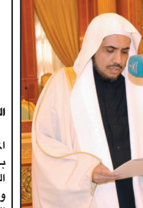
د. العيسى خلال أدائه القسم (و. أ. س)

الرياض - و. أ. س: تلقى صاحب السمو الملكي الأمير فيصل بن عبدالله بن عبدالعزيز رئيس هيئة الهلال الأحمر السعودي التقدير من مدير عام حرس الحدود الفريق ركن طلال بن محسن العقراوي على ما يقوم به ويبدله رجال الهلال الأحمر السعودي في تقديم الخدمات الطبية الإسعافية لمنسوبي القطاعات الأمنية وقاطني المناطق الحدودية في جميع أنحاء المملكة العربية السعودية جنباً إلى جنب مع اخوانهم حرس الحدود. جاء ذلك في برقية لسموه من مدير عام حرس الحدود. فيما أكد صاحب السمو الملكي الامير فيصل بن عبدالله في