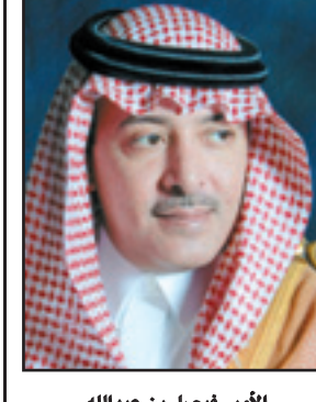
الأمير فيصل بن عبدالله

الرياض - و. أ. س: تلقى صاحب السمو الملكي الأمير فيصل بن عبدالله بن عبدالعزيز رئيس هيئة الهلال الأحمر السعودي التقدير من مدير عام حرس الحدود الفريق ركن طلال بن محسن العقراوي على ما يقوم به ويبدله رجال الهلال الأحمر السعودي في تقديم الخدمات الطبية الإسعافية لمنسوبي القطاعات الأمنية وقاطني المناطق الحدودية في جميع أنحاء المملكة العربية السعودية جنباً إلى جنب مع اخوانهم حرس الحدود. جاء ذلك في برقية لسموه من مدير عام حرس الحدود. فيما أكد صاحب السمو الملكي الامير فيصل بن عبدالله في