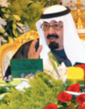
خادم الحرمين مترأساً جلسة مجلس الوزراء

الحكومة اللبنانية السابق رفيق الحريري ما يحقق العدالة التي يتطلع إليها الجميع. وأوضح معالي الدكتور عبدالعزيز بن محيي الدين خوجة أن