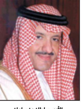
الأمير سلطان بن سلمان

الرياض - والرياض: رفع صاحب السمو الملكي الأمير سلطان بن سلمان بن عبدالعزيز رئيس الهيئة العامة للآثار والسياحة ورئيس مؤسسة التراث أسمى آيات الشكر والعرقان إلى مقام خادم الحرمين الشريفين الملك عبدالله بن عبدالعزيز - حفظه الله - على رعايته ودعمه للعناية بالتراث والمحافظة عليه، مشيراً إلى تكلفه في هذا الإطار بتكاليف إعادة ترميم مسجد الشافعي والمعاهد في جدة، مما يعد استمراراً لجهود - حفظه الله - في المحافظة على التراث الوطني، والتي تمثل نموذجاً عالياً يستحق الاقتداء، اعتداده وافخراً بإراثنا الحضاري. كما أشاد سموه بدعم صاحب السمو الملكي الأمير سلطان بن عبدالعزيز ولي العهد نائب رئيس مجلس الوزراء وزير الدفاع والطيران والمفتش العام - حفظه الله - لرعايته انطلاقة البرنامج الوطني للمساجد العتيقة، منوها بما يجده هذا البرنامج من دعم كبير من سموه. جاء ذلك بمناسبة افتتاح صاحب السمو الأمير بدر بن محمد بن جلوي آل سعود محافظ الأحساء، مسجد الجبري بالهفوف؛ ليصبح بذلك أول مسجد يتم ترميمه في إطار البرنامج الوطني للعناية بالمساجد العتيقة، الذي تتبناه مؤسسة التراث بإشراف وزارة الشؤون الإسلامية والأوقاف والدعوة والإرشاد. وأوضح الأمير سلطان بن سلمان أن هذا البرنامج يهدف إلى الاهتمام بالمساجد ذات الأهمية العمرانية المحلية في مناطق المملكة المختلفة، التي تحتاج إلى التاهيل، وإعادة الأعمار، وفق المعايير العالمية للمحافظة على التراث العمراني. وأضاف سمو رئيس مؤسسة التراث حبان الآن من خلال