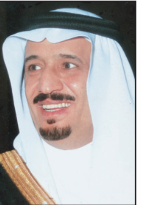
الأمير سلمان بن عبد العزيز

وكان صاحب السمو الملكي الأمير الفريقي ركن متعب بن عبدالله بن عبدالعزيز نائب رئيس الحرس الوطني المساعد للشؤون العسكرية قد قام أولاً بتسليم سمو الأمير سلطان بن سلمان شيكاً يمثل ربع مزار إقامة إسطنبول أبناء الملك عبدالله بن عبدالعزيز لعدد من الجياد وتم تخصيص ريعه لصالح جمعية الأطفال المعوقين في إطار ما تحظى به الجمعية من مساندة دائمة ودعم كريم من أبناء خادم الحرمين الشريفين.