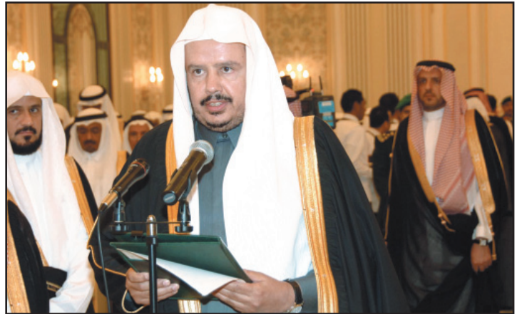
د. عبدالله آل الشيخ يؤدي القسم بين يدي خادم الحرمين