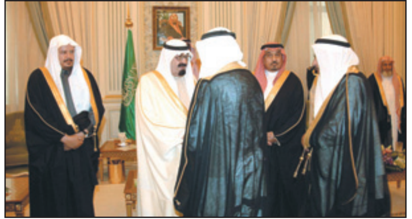
خادم الحرمين يصافح أعضاء مجلس الشورى