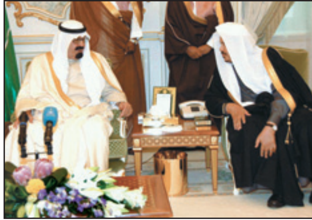
خادم الحرمين يتحدث إلى الدكتور عبدالله آل الشيخ