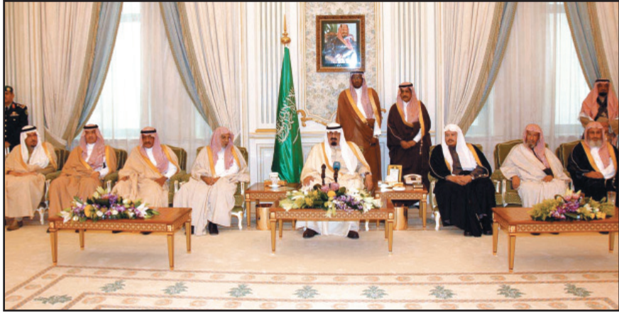
خادم الحرمين خلال أداء رئيس مجلس الشورى والأعضاء القسم بين يدي مقامه السامي