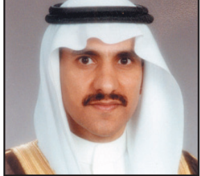
د. بندر العيبان

الرياض - (و.أ.س): تشارك الملكة ممثلة في هيئة حقوق الإنسان في الدورة التاسعة لمجلس حقوق الإنسان في جنيف التي تقام خلال الفترة من ٢ إلى ٢٧ مارس الجاري. ويرأس الوفد المشارك في الدورة رئيس هيئة حقوق الإنسان الدكتور بندر بن محمد العيبان حيث يلقي كلمة أمام المجلس الأممي يعكس من خلاله سياسات المملكة في التعامل مع حقوق الإنسان ورؤيتها الحالية والمستقبلية لتعزيز وحماية حقوق الإنسان على المستويين المحلي والدولي.