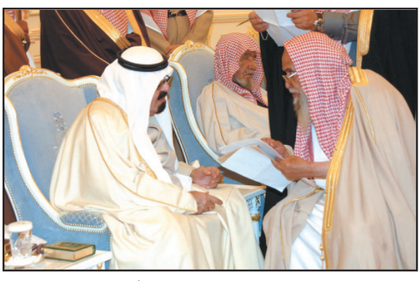
خادم الحرمين خلال الاستقبال