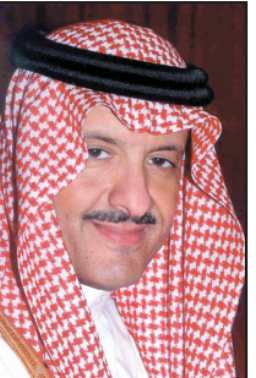
الأمير سلطان بن سلمان

الرياض - محمد الحبير: وصف صاحب السمو الملكي الأمير سلطان بن سلمان بن عبدالعزيز رئيس مجلس إدارة جمعية الأطفال المعوقين افتتاح أول مركز ترفيهي لذوي الاحتياجات الخاصة في الرياض بأنه إحدى صور الرعاية المتكاملة التي تحظى بها فئة المعوقين في مملكة الإنسانية.