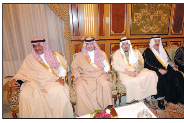
أصحاب السمو الملكي الأمراء وأصحاب المعالي خلال حضورهم الاستقبال

وقال سموه في تصريح صحافي بمناسبة افتتاح المركز «يسعدني ويشرفني بالإنابة عن المهتمين بقضية الإعاقة وكذلك الآلاف من أولياء أمور الأطفال المشمولين بخدمات جمعية الأطفال المعوقين أن أتقدم لصاحب السمو الملكي الأمير سلطان بن عبدالعزيز أمير منطقة الرياض بأسمى آيات الشكر والتقدير على هذا الإنجاز الجديد الذي يضاف لمنظومة الصروح الحضارية والخدمية في العاصمة ولسمو الأمير الدكتور عبدالعزيز بن محمد بن عياف أمين منطقة الرياض الخاص التهنئة على قيادة الأمانة في تبني مثل هذه المشروعات الحضارية التي تجسد رقي وتكامل الخدمات في عاصمة المملكة». وأكد سموه أن المراكز الترفيهية الخاصة بالمعوقين تعد إحدى أهم تطلعات هذه الفئة الغالية التي تضمنتها توصيات المؤتمر الدولي الثاني