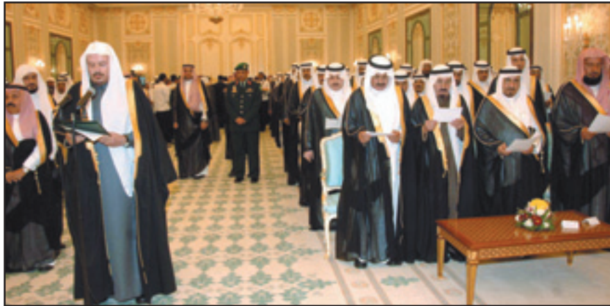
آل الشيخ والأعضاء خلال أداء القسم بين يدي خادم الحرمين