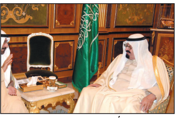
خادم الحرمين مستقبلاً نائب رئيس مجلس الوزراء وزير الخارجية الكويتي