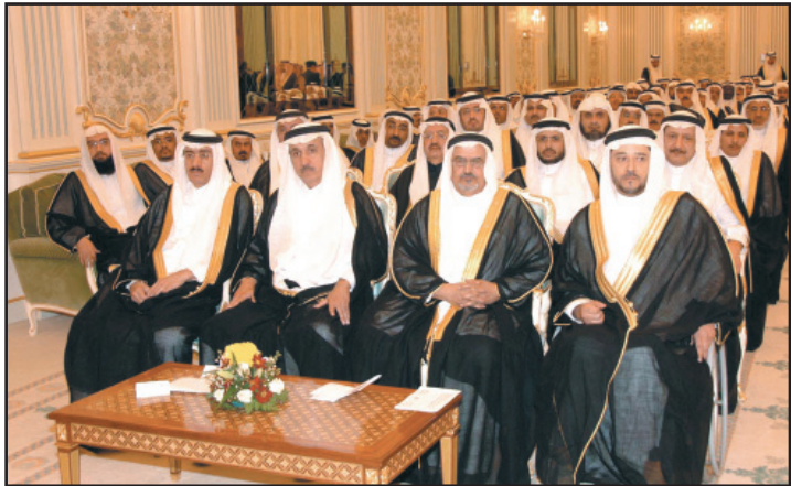
جانب من أعضاء مجلس الشورى خلال تشرفهم بلقاء خادم الحرمين

الرياض - (و.أ.س): تشرف بأداء القسم بين يدي خادم الحرمين الشريفين الملك عبدالله بن عبدالعزيز آل سعود حفظه الله في الديوان الملكي بقصر اليمامة امس معالي رئيس مجلس الشورى الدكتور عبدالله بن محمد بن إبراهيم آل الشيخ وأعضاء المجلس.