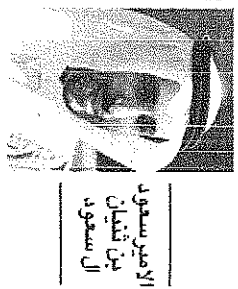
الأمير سعود بن عبدالعزيز آل سعود

تفقد خادم الحرمين الشريفين الملك عبدالله بن عبدالعزيز آل سعود في رحمة الله جسدته بعد أن قضى في المنفى ما يقرب من 14 عاماً، وقد كان من أبرز الشخصيات السياسية والفكرية في المملكة العربية السعودية.