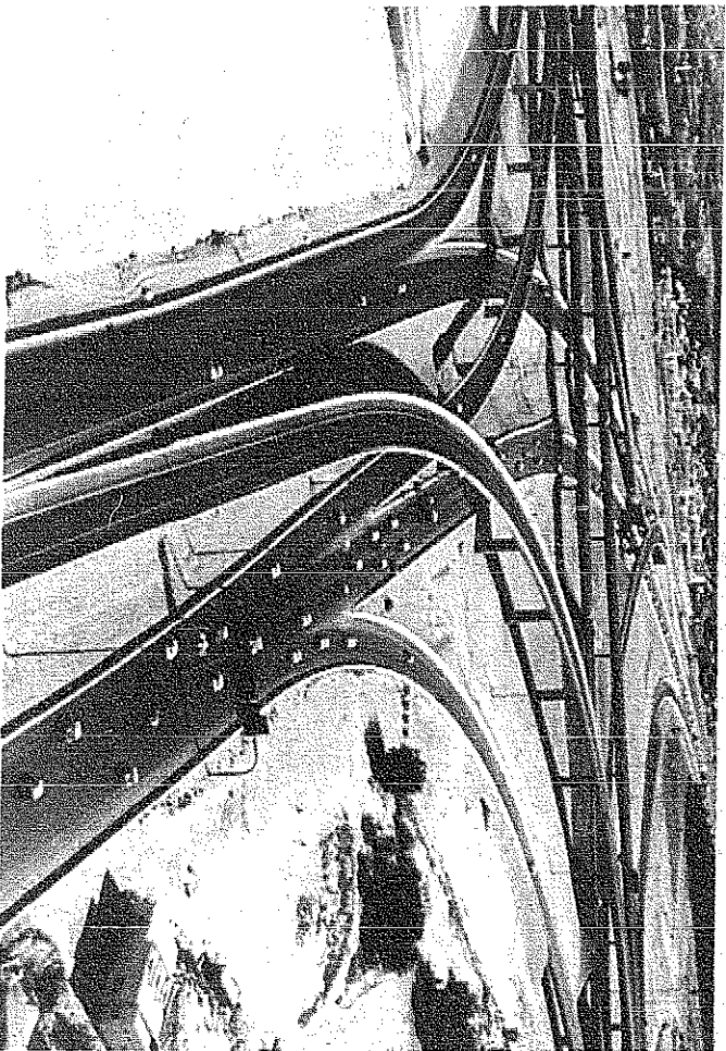
شبكة طرق حديثة

من اصدار وزير موالف السيارات في المملكة العربية السعودية في المم المتحدة لتأسيس المؤسسة وتضم ٢٠٠٠ المم تعرض القسم الأول صور الحياة في المنطقة التي قبل عهد الملك عبد العزيز (طيب الله ثراه) فيما تعرض القسم الثاني من أجل تأسيس المؤسسة وتضم القسم الثالث من صور مشاريع ومجموعات من مشاريع المؤسسة في مختلف المجالات، ويشرف سمو ولي العهد على حفل الافتتاح الذي سيقوم به رئاسة زيارة سموه ويقدم على كلمة شكر من سموه في افتتاح المصفاة وحل مشاكل الجامعة .