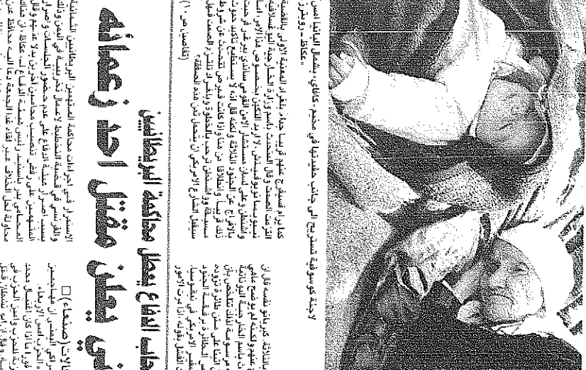
الملك يحضو الصلاة بسبب التأخير

ملكنا الملك فيصل بن عبدالعزيز آل سعود... الملك فيصل بن عبدالعزيز آل سعود تذكريته في الذكرى السنوية لميلاده، والذي ولد فيه يوم ٢٥ من شهر ربيع الثاني سنة ١٢٥٥ هـ. كان من أهم حكام المملكة العربية السعودية، وقد لعب دوراً بارزاً في تطويرها وتأسيسها على أسس سليمة. يذكره الشعب السعودي بحب ووقار، باعتباره من الملوك العظماء الذين ساهموا في نهضة بلادهم.