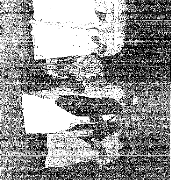
الملك يحضو الصلاة بسبب التأخير