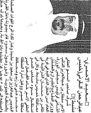
الأمير سلطان بن عبدالعزيز آل سعود