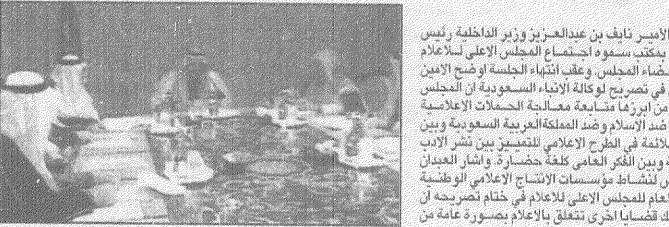
سمو الامير نايف يرأس اجتماع المجلس

الرياض - الرياض [ ] واس صاحب السمو الملكي الامير نايف بن عبدالعزيز وزير الداخلية رئيس المجلس الاعلى للاعلام مساء امس يمتكث سموه اجتماع المجلس الاعلى للاعلام بحضور اصحاب السمو والمعالي اعضاء المجلس، وعقب انتهاء الجلسة اوضح الامير العام للمجلس عبدالرحمن العبدان في تصريح لوكالة الانباء السعودية ان المجلس ناقش القضايا الاعلامية المهمة ومن أبرزها متابعة معالجة الحملات الاعلامية المفرضة التي يشهدها الاعلام العربي ضد الاسلام ونداء المملكة العربية السعودية والابن العربي تحت تلك الاسماء الملائمة في الطرح الاعلامي لتتضمن بين ثر العبدان الشعبي صبغته جزا من ثراء الامة بين الفكر العالمي كافة جسدات وأشار العبدان الى ان المجلس ناقش توفير الفرص للشباب مؤسسات الاعلامي الوطنية وضوابطه فذو الفهم، وبين الامير العام للمجلس الاعلى للاعلام في ختام تصريحه ان المجلس استعرض بالاضافة الى ذلك قضايا اخرى تتعلق بالاعلام بصورة عامة من حيث تطوير التنمية الاعلامية وتنشيط الطرح الاعلامي.