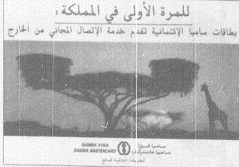
للمرة الأولى في المملكة

بطاقات ساميا الإثباتية تقدم خدمة الإتصال المجاني من الخارج