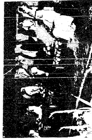
جلالة الملك فهد يشرف حفل العشاء الذي اقامه اهل المدينة المنورة

د. يماني : جلاله الملك أكد على سعاده بخدمته بخرميين الشريفيين