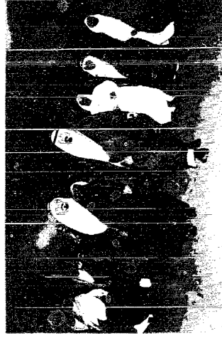
صاحب السمو الملكي الأمير عبدالله بن عبدالعزيز لدى وصوله الى مطار الملك عبدالعزيز بجدة

حسبنا اننا الإسلامية أه عام الحرك بجمع الشرح