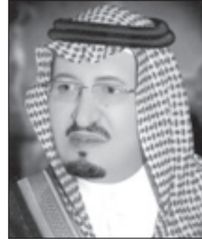
الأمير عبدالرحمن بن ناصر

التي تجسد أصدق معاني الرعاية والاهتمام من قبل القيادة الحكيمة لأبنائها في كافة مناطق المملكة لتوفير سبل العلم وإنشاعة نور الثقافة والأخذ بأسباب الرقي والتقدم والتطور لما فيه خير الوطن وأبنائه. وأكد سمو الأمير عبدالرحمن بن ناصر أن الموافقة تمثل لفظة كريمة من خادم الحرمين الشريفين الملك عبدالله بن عبدالعزيز لأبنائه في الخرج مؤكداً أن هذه الجامعة ستكون مشعل نور ومنبر ثقافة وعلم من أجل تعزيز مسيرة التنمية في مدن الخرج وفي محافظات جنوب منطقة الرياض والتي تجد من الدولة الرعاية والعناية.