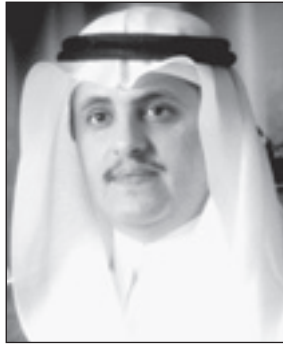
د. محمد الصالح

بمناسبة الموافقة السامية على قرار مجلس التعليم العالي بإنشاء أربع جامعات جديدة بالملكة عبر الأمين العام لمجلس التعليم العالي الدكتور محمد بن عبدالعزيز الصالح عن سعادته باضافة أربع جامعات علمية جديدة إلى العشرين جامعة الأخرى، ومضيفاً بأن خلال سنوات قليلة قد ارتفع عدد الجامعات الحكومية وعشرين جامعة منتشرة في مختلف مناطق ومحافظات المملكة، ويأتي ذلك تنفيذاً لتوجيهات خادم الحرمين الشريفين رئيس مجلس التعليم العالي بافتتاح المؤسسات التعليمية في مختلف المحافظات بالمملكة. وأضاف الدكتور الصالح بأن من أهم المبررات التي دعمت مجلس التعليم العالي لإنشاء جامعة الخرج وشقراء والجمعة ما تواجهها جامعة الملك سعود من تحديات قد تعوق مسيرة التطوير والتحديث فيها بسبب عوامل كميّة،