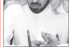
الدكتور علي العطية

بين الأمم، ويؤكد أيضاً اهتمام حكومة خادم الحرمين الشريفين على توفير فرص التعليم العالي لأبناء المملكة بمناطق إقامتهم، مضيفاً أن إنشاء الجامعات الأربع تأكيد جديد على الحرص على الجودة ثم الجودة حيث أن هذه الجامعات ستخفف الضغط على جامعتي الملك سعود والملك فيصل وتمكنهما من تأدية مهامهما الأكاديمية والبحثية على الوجه الأمثل كما أنها ستوسع من قاعدة التعليم العالي الذي انتشرت مؤسساته في مناطق المملكة ومحافظاتها خدمة لأبنائنا الطلبة والطالبات وتوفير