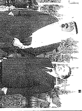
سمول ولي العهد لدى مغادرته الجاهز