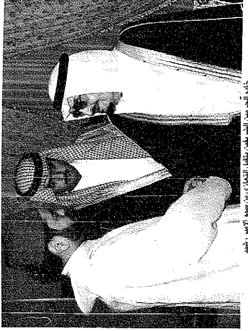
تألم الحبيب موريا من بركات التعازي وعاد الى جدة امس