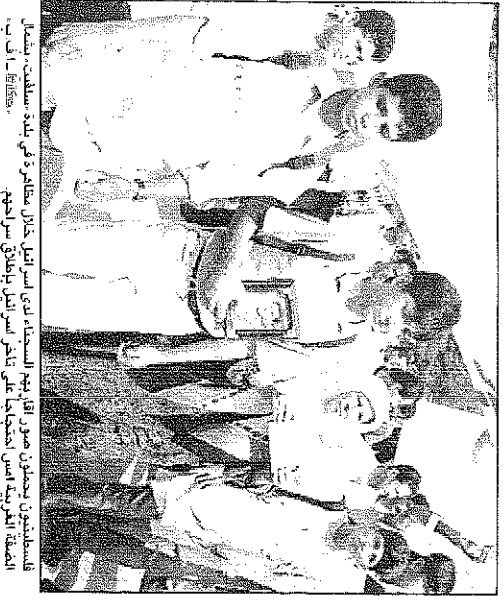
الامينون مجتمعون في مؤتمر الامم المتحدة لدراسة اوضاع الاسرى الفلسطينيين في غزة . يشار الى رابين في الوسط .

يشير بيان صادر عن الامم المتحدة والامينون والمجلس التنفيذي لوكالة الامن الى ان الامم المتحدة قد وافقت على قرار جديد يدين المستوطنات في الضفة الغربية المحتلة في ٢٠ - ٢١ من الشهر الجاري في ضوء قرار الجمعية العامة رقم ٢٤٤٣ الصادر في ٢٠ كانون الثاني ١٩٦٧ الذي يدعو الى ازالة هذه المستوطنات. والقرار الجديد يدين ايضا المستوطنات التي تبنى في الضفة الغربية المحتلة منذ عام ١٩٦٧. والقرار الجديد هو الاول من نوعه الذي يدين هذه المستوطنات منذ انشائها في عام ١٩٤٨. والقرار الجديد يدين ايضا المستوطنات التي تبنى في الضفة الغربية المحتلة منذ عام ١٩٦٧. والقرار الجديد هو الاول من نوعه الذي يدين هذه المستوطنات منذ انشائها في عام ١٩٤٨.