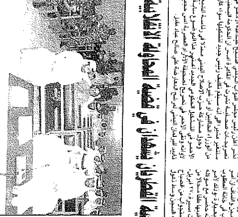
اجتماع لعضوات الحكومة في ٢٠ كانون الثاني ١٩٦٤.

الرئيس الهندي يكثف فاجباتي تشكيل الحكومة اليوم. وفي بيان صادر عن الرئيس في ٢٠ كانون الثاني ١٩٦٤، ورد ان الرئيس قد وافقت على هذا القرار. وفي بيان صادر عن الرئيس في ٢٠ كانون الثاني ١٩٦٤، ورد ان الرئيس قد وافقت على هذا القرار.