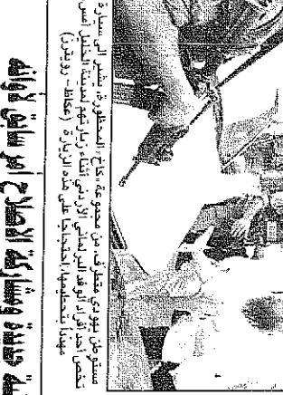
اجتماع لعضوات لجنة المتابعة في ٢٠ كانون الثاني ١٩٦٤.

تدعو لجنة المتابعة الى حل قضية حماس بالحوار. وفي بيان صادر عن اللجنة في ٢٠ كانون الثاني ١٩٦٤، ورد ان اللجنة قد وافقت على هذا القرار. وفي بيان صادر عن اللجنة في ٢٠ كانون الثاني ١٩٦٤، ورد ان اللجنة قد وافقت على هذا القرار.