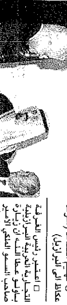
عكاظ الى البرازيل (موقف

□ فهدج الحاصم (موقف عكاظ الى البرازيل) □ اعطى وزير التجارة البرازيلية بنازول عطا الشارة لزيارة عبدالله بن عبدالعزيز وزير التجارة والتمويل والسياحة الوزير واثبت رئيس مجلس التجارة والتمويل والسياحة الوزير واثبت رئيس مجلس التجارة والتمويل والسياحة