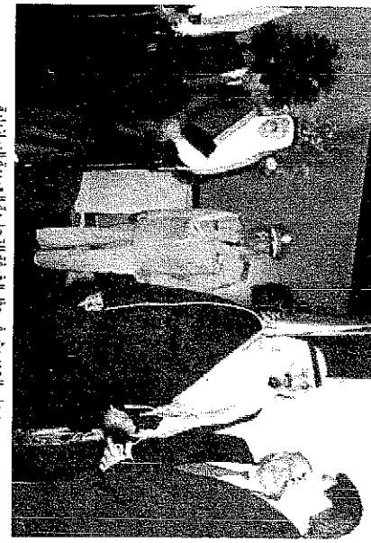
سمو ولي العهد يشارك حفل الترحيب التجارية البرية البرازيلية

□ فهدج الحاصم (موقف عكاظ الى البرازيل) □ اعرب وزير الاقتصاد البرازيلي السيد بيرو ان زيارة سمو ولي العهد التي منبذت حلفت خجها كمن اجناه اعطاه دفعة قوية العلاقات بين البلدين بصفحة عظمة والعلاقات الاقتصادية بصفحة عظمة وزير الاقتصاد البرازيلي في تصريحات خاصة لـ «عكاظ» ان العلاقات الاقتصادية بين البلدين مستهدفة جدا من الامم