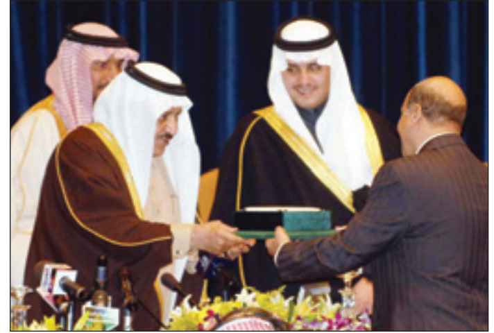
سمو النائب الثاني يحرم أحد الفائزين