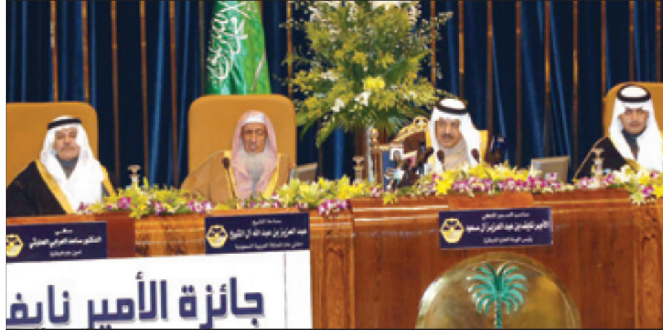
الامير نايف خلال رعايته الحفل الختامي

الجائزة تسابق على نيلها ١٩٣٨ من العلماء والمفكرين والأكاديميين والباحثين في العالم فيما تسابق على جائزة مسابقة حفظ الحديث النبوي للناشئة والشباب ١٤١٥٧٨ من الناشئة وفاز بالجائزة حتى الآن ١٥ بحثاً وكل هذا ليكن ليحقق إلا بتوفيق الله ثم بصديق النية وسلامة الرؤية وعمقها وقوة العزيمة وصلابة الإرادة في تجاه تحقيق هذه الغاية السليمة والمطلب النبيل. وقال "إن الأمر المهم والأساس هو أن أي عمل بهذا السمو والريادة لا بد له من بيئة صالحة آمنة مطمئنة وهذه هي المملكة ماضياً وحاضراً ومستقبلاً بإذن الله تعالى وفق ما أسس عليها كيانها الملك عبدالعزيز رحمه الله "لافتاً النظر إلى أنها قامت على نهجين أساسيين لا تحيد عنهما وهما تهادن الله وسنة نبيه صلى الله عليه وسلم مصدرين أساسيين تحكم بهما القول والفعل جعل المملكة تتسمت بالمجد في كل شأن في الحياة. ثم ألقى الأمين العام لمنظمة المؤتمر الإسلامي الدكتور أحمد الدين إحسان أوغلي كلمة الحضور بين فيها أن هذه الجائزة تحمل في ثناياها إحياء للسنة النبوية العطرة وما حملته للبشرية من الحق ومن دين وحضارة وقدم سامية عبرت مجرى تاريخ العالم كله.