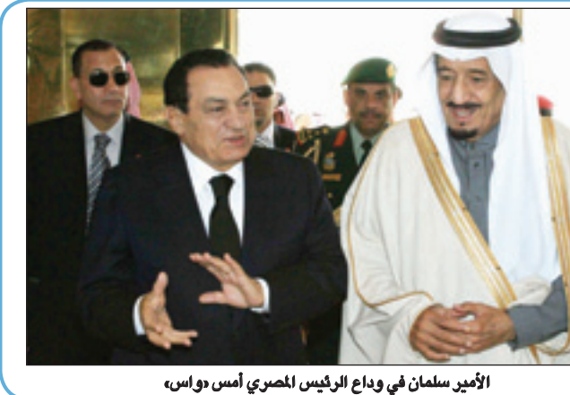
الأمير سلمان في وداع الرئيس المصري أمس "واس"