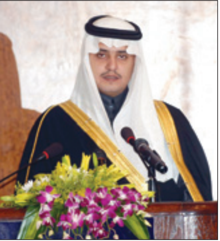
الأمير نواف بن نايف يلقي كلمته