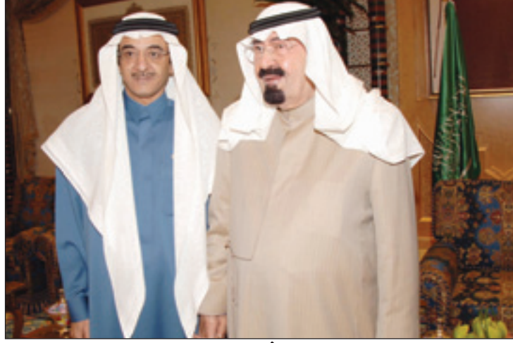
الملك عبدالله يستقبل الأمير محمد بن فهد بن محمد

فهد بن محمد بن عبد الرحمن الذي عبر عن شكره وتقديره لخادم الحرمين الشريفين على عزائه ومواساته له في وفاة والدته رحمها الله. وقد دعا خادم الحرمين الشريفين الله عزوجل أن يتغمدها بواسع رحمته ويدخلها فسح جنته وأن يلهم أهلها وذويها الصبر والسلوان.