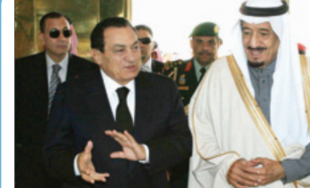
الأمير سلمان في وداع الرئيس المصري أمس

محمد بن سلمان بن عبدالعزيز وصاحب السمو الملكي الأمير بندر بن سلمان بن عبدالعزيز ونائب رئيس المراسم الملكية الدكتور عبد الرحمن بن عبدالعزيز الشلهوب ومدير عام مطار الملك خالد الدولي المكلف المهندس عبدالله الطاسان ومدير شرطة منطقة الرياض اللواء عبدالله بن سعد الشمراني وسفير مصر لدى المملكة محمود محمد عوف.