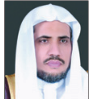
الدكتور محمد العيسى

وليس في الشر أسوة، ولا في الخطأ قدوة، ولا دليل أهدى من التوفيق، وقد أبرأ خادم الحرمين الشريفين بهذا الإجراء الحاسم ذمته، ودلل بالقابيس القيادية أن عزائم الأمور في خيارها، وأن للمسؤوليات تبعات تتقى عواقبها، ترجم ذلك ما ورد في الأمر الكريم من تمكين لجنة التحقيق وتقصي الحقائق من استدعاء أي شخص أو مسؤول - كائناً من كان - بطلب إفادته أو مساعدته عند الاقتضاء، وتوجيهها بالجد والمثابرة في عملها، بما تبرأ به الذمة أمام الله عز وجل، وأن الأمر من ذمة خادم الحرمين الشريفين إلى ذمة اللجنة، وتذكيرها باستشعار عظم المسؤولية، وجسامتها (الخطب)، سائلاً الله أن يحفظ خادم الحرمين الشريفين، وببقية نخراً للبلاد والعباد، في عمر مديد وعمل صالح متقبل مرور.