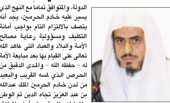
الشيخ عبدالعزيز بن حميد الحميد

الدولة، والمتوافق تماماً مع النهج الذي يسير عليه خادم الحرمين، يجد أنه يتصف بالالتزام التام بواجب أمانة التكليف ومسؤولية رعاية مصالح الأمة والبلاد والعباد التي عاهد الله تعالى على القيام بها بعد مبايعة الأمة له - حفظه الله - والدى الدقيق من الحرص الذي لمسه القريب والبعيد من لدن خادم الحرمين الملك عبدالله بن عبد العزيز تجاه الدين ثم الوطن والمواطن وكل مقيم على أرض المملكة، مبيناً أن تصدي الملك لهذه المسألة استجابة لواجبه الشرعي وضميره الأخلاقي والتزامه الشخصي الذي عرف فيه الشجاعة بالحفاظ على مصالح المسلمين وحقوقهم. وأكد أن خادم الحرمين وسمو ولي عهده الأمين وسمو النائب الثاني يرون في كل ابن وابنة في هذه المملكة ابناً وبناتنا لهم، وأنهم -حفظهم الله- شعروا بنفس الأسى والألم على المفقودين الذي شعر به ذنوبهم. وهو ما نشعر به جميعاً ونرفع فيه أنا وزملائي بهيئة الأمر بالمعروف والنهي عن المنكر الدعاء لله تعالى أن يجنب البلاد والعباد الابتلاءات والمحن. واختتم الحميد قائلاً: "نرجو من الله تعالى للضحايا الرحمة وأن يجمعنا وإياهم في جنات النعيم وأن يخلف ذنوبهم خيراً، وأن يحفظ بلادنا من كل شر ومكروه".