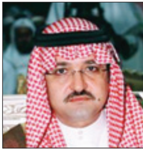
الأمير مشعل بن ماجد

عبر صاحب السمو الملكي الأمير مشعل بن ماجد بن عبد العزيز محافظ جدة عن عظيم الامتنان والشكر والتقدير والعرفان للقائد والأب والإنسان خادم الحرمين الشريفين الملك عبدالله بن عبدالعزيز حفظه الله ..