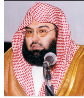
د. عبدالرحمن السديس

خير وصالح وأمن بين أبناء المجتمع، وكان فضيلة إمام وخطيب المسجد الحرام الشيخ عبدالرحمن السديس قد زار جامعتي العلم والهدى ودار العلوم في مدينة إسلاك برن يرافقه اللورد آدم باتيل عضو مجلس اللوردات البريطاني.