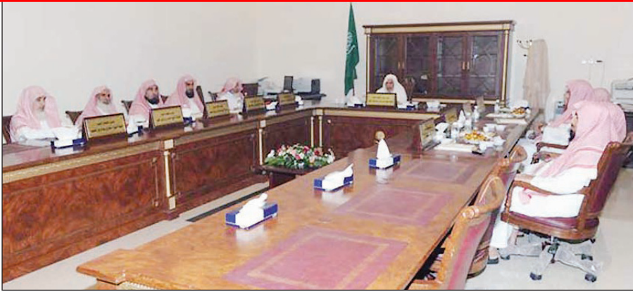
اجتماع المحكمة العليا لرؤية هلال شهر رمضان لعام ١٤٣١هـ بالطائف