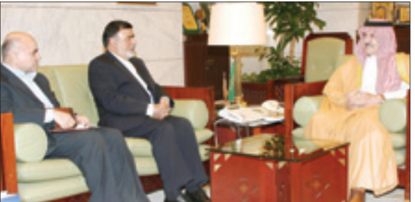
الأمير سطاتم مستقبلا السفير الإيراني

العيساي للسيارات ALESAYI MOTORS www.alesayi-motors.com الرقم المجاني: ٨٠٠ ٢٤٤ ٠٠٦٠