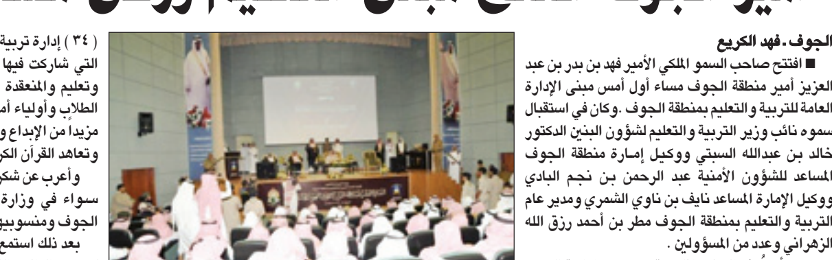
سومه أثناء الاحتفال

في التخطيط والتنظيم لهذه المسابقة بما يحقق لها النجاح في أفضل صورة.