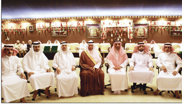
السفير السنوسي يستضيف معالي الدكتور عبدالله الربيعة، (الرياض)

عبد الله الربيعة كان قد وصل إلى العاصمة الكندية أوتاوا في زيارة رسمية استغرقت عدة أيام تلبية لدعوة كل من معالي وزيرة الصحة ومعالي وزير التجارة الدولية في كندا، وذلك لبحث سبل زيادة وتطوير التعاون بين البلدين في المجال الصحي.