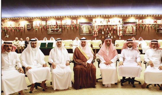
السفير الغدير يتوسط الأعضاء المكرم في الحفل

وفي نهاية الحفل قدم السفير دروعا تذكارية بهذه المناسبة للمكرمين. هذا وحضر الحفل الذي أقيم في الخيمة السعودية بمقر السفارة في العاصمة إسلام آباد رؤساء المكاتب السعودية التابعة للسفارة في باكستان ومدربي وطلاب المدرسة السعودية في إسلام آباد وعدد من الطلبة السعوديين المبتعثين في باكستان.