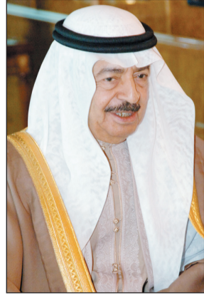
الأمير خليفة بن سلمان آل خليفة

وقال الأمير خليفة إن مملكة البحرين بقيادة حضرة صاحب الجلالة الملك حمد بن عيسى آل خليفة تحرص أشد الحرص على ترسيخ وتعزيز مسيرة العمل الخليجي المشترك باعتباره مصدراً للقوة السياسية والاقتصادية. وأكد صاحب السمو إن غاية ما تنتظر إليه هو رؤية كيان خليجي مشترك يعمل في إطار إستراتيجية مستقبلية تظلها قوة دافعة تسير في مختلف الاتجاهات وتتغلب على كل التحديات لتحقيق آماني وطموحات شعوب المنطقة في تحقيق مزيد من التقدم والرفاهية.