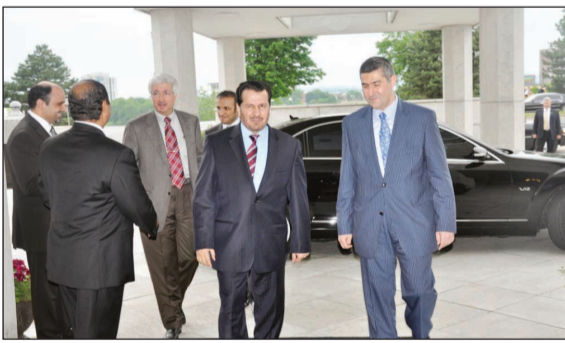
السفير السنوسي يستضيف معالي الدكتور عبدالله الربيعه، (الرياض)

عبد الله الربيعه كان قد وصل إلى العاصمة الكندية أوتاوا في زيارة رسمية استغرقت عدة أيام تلبية لدعوة كل من معالي وزيرة الصحة ومعالي وزير التجارة الدولية في كندا، وذلك لبحث سبل زيادة وتطوير التعاون بين البلدين في المجال الصحي.