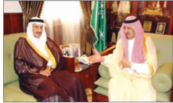
أمير الخرج يستقبل المهندس الحجيل

الخرج - عبد الرحمن المقرن استقبل صاحب السمو الملكي الأمير عبد الرحمن بن ناصر بن عبد العزيز محافظ الخرج بمكتب سموه بالمحافظة الرئيس العام للمؤسسة العامة للخطوط الحديدية المهندس عبد العزيز بن محمد الحجيل ونائب رئيس المؤسسة العامة للخطوط الحديدية المهندس حمد عبد القادر ومدير مشروع المدينة الصناعية بالخرج المهندس محمد الطميري ورئيس بلدية محافظة الخرج المهندس إبراهيم أبو رأس. وتم خلال الاستقبال مناقشة ربط المدن الصناعية بالخرج بالشبكة الوطنية للسكك الحديدية