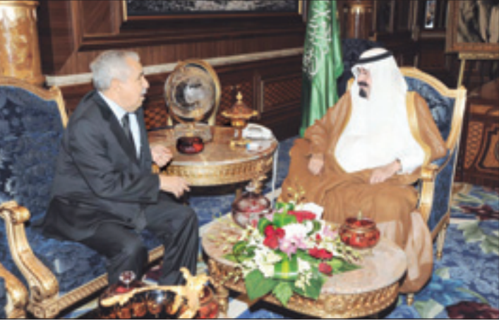
الملك عبد الله يستقبل الدكتور علي التريكي

صاحب السمو الملكي الأمير عبدالعزيز بن عبدالله بن عبدالعزيز مستشار خادم الحرمين الشريفين ومعالي وزير الدولة للشؤون الخارجية الدكتور نزار بن عبيد مدني.