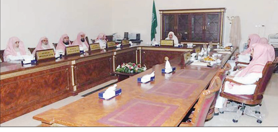
اجتماع المحكمة العليا لرؤية هلال شهر رمضان لعام ١٤٣١هـ بالطائف

ومن هذا المنطلق، فإن المملكة التي شرفها الله بخدمة الحرمين الشريفين