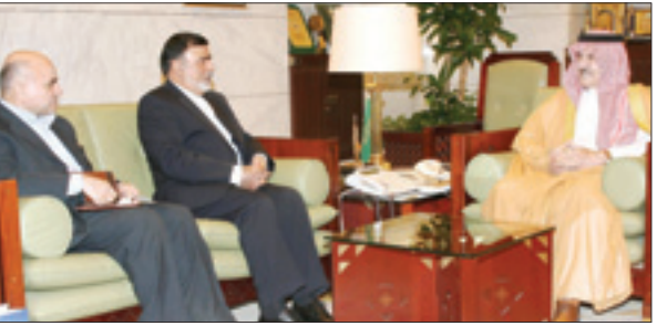
الأمير سطاتم مستقبلاً السفير الإيراني

العيساي للسيارات ALESAYI MOTORS www.alesayi-motors.com الرقم المجاني: ٨٠٠ ٢٤٤ ٠٠٦٠