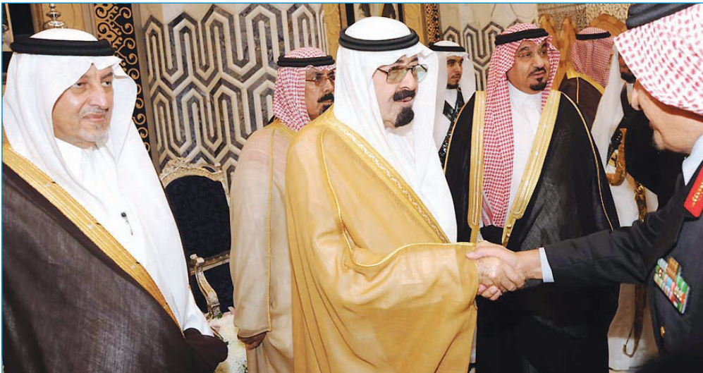
الملك عبدالله لدى وصوله جدة

* القائم بالأعمال بالسفارة البريطانية في الرياض