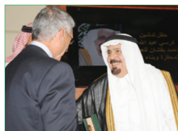
وزير التعليم العالي خلال الاحتفال

الحفية التي أنشأتها الجامعة، والتي تسعى بكل قوتها للتميز على المستوى العالمي ومازلنا ننتظر منها الكثير على المستوى العالمي، لما لسته من حماس ورغبة وتأهيل لدى العاملين بالجامعة على كافة المستويات لتحقيق مثل هذه الإنجازات العالية. وأضاف الدكتور العنقري أن هذه المناسبة تجسد مفهوم الشراكة المجتمعية بقوة مؤكداً أن جامعة الملك سعود من الجامعات الرائدة التي تعكس هذه الشراكة مع القطاع الأهلي والخاص في