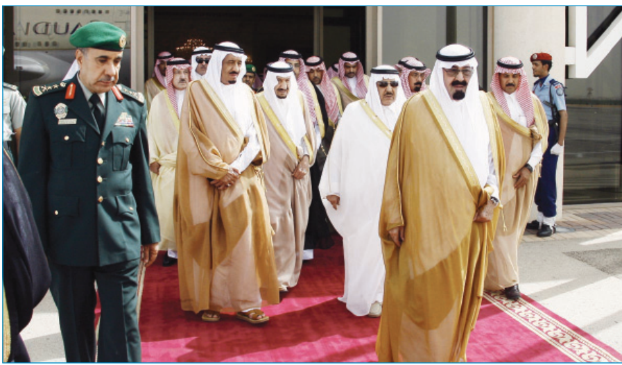
خادم الحرمين لدى مغادرته الرياض

وكان حفله الله قد غادر الرياض أمس متوجهاً إلى جدة. وكان في وداع الملك المقدي لدى مغادرته مطار قاعدة الرياض الجوية صاحب السمو الأمير محمد بن عبدالله بن جلوي وصاحب السمو الملكي الأمير عبدالرحمن بن عبدالعزيز نائب وزير الدفاع والطيران والمفتش العام وصاحب السمو الأمير بندر بن محمد بن عبدالرحمن وصاحب السمو الأمير متعب بن عبدالعزيز وصاحب السمو الملكي الأمير نايف بن عبدالعزيز النائب الثاني لرئيس مجلس الوزراء وزير الداخلية وصاحب السمو الملكي الأمير سلمان بن عبدالعزيز أمير منطقة الرياض وصاحب السمو الملكي الأمير سطاتم بن عبدالعزيز نائب أمير منطقة الرياض وصاحب السمو الأمير مساعد بن عبدالرحمن وصاحب السمو الملكي الأمير محمد بن سعد بن عبدالعزيز مستشار سمو وزير الداخلية وصاحب السمو الأمير فيصل بن عبدالرحمن وصاحب السمو الأمير سعود الفيصل بن عبدالرحمن وصاحب السمو الملكي الأمير سعود بن عبدالعزيز وصاحب السمو الملكي الأمير خالد بن مساعد بن عبدالرحمن وصاحب السمو الأمير الدكتور تركي بن محمد بن سعود الكبير وكيل وزارة الخارجية للعلاقات متعددة الأطراف وصاحب السمو الملكي الأمير الدكتور منصور بن متعب بن عبدالعزيز وزير الشؤون البلدية والقروية وأصحاب السمو الملكي الأمراء. كما كان في وداع الملك المقدي حفله الله معالي رئيس مجلس الشورى وأصحاب المعالي الوزراء وكبار المسؤولين من مدنيين وعسكريين وجمع من المواطنين. حفظ الله خادم الحرمين الشريفين في سفره وإقامته.