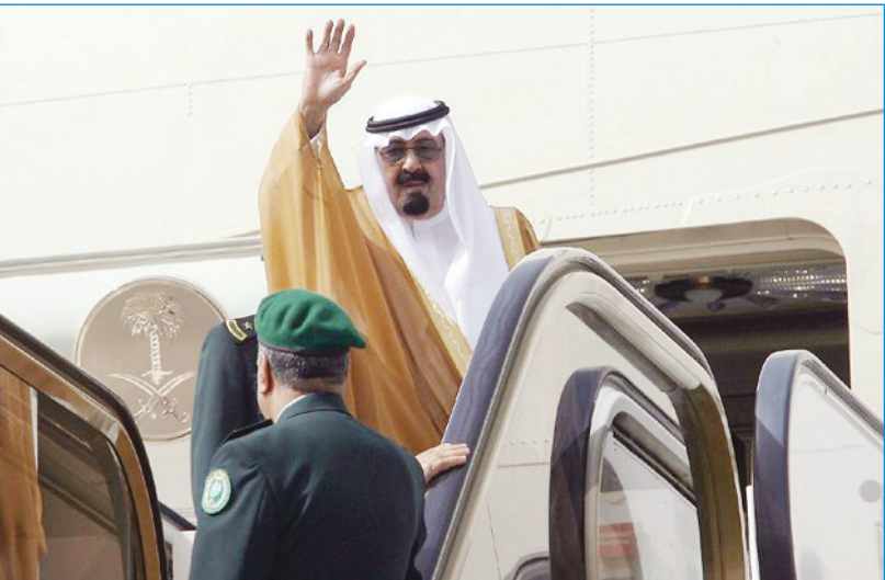
الملك عبدالله مغادراً الرياض