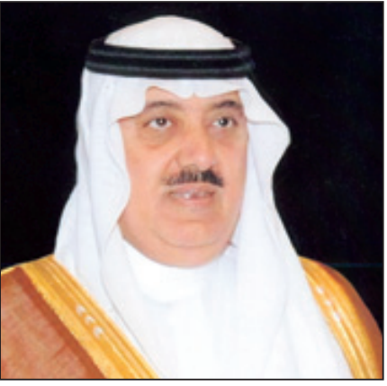
الأمير متعب بن عبدالله

كما عبر الأمير متعب بن عبدالله عن بالغ تقديره لصاحب السمو الملكي الأمير بدر بن عبدالعزيز حفظه الله، وقال سموه: لقد تشرفت بالعمل تحت رئاسة سموه لفترة طويلة وكان نعم الأب والموجه والمسؤول لي وزملائي منسوبي الحرس الوطني كافة، حيث شملنا بتوجيهاته الدائمة ومتابعته المستمرة التي كان لها أكبر الأثر في كل ما تحقق للحرس الوطني من تقدم وازدهار داعياً المولى القدير أن يمد سموه بالصحة والعافية.