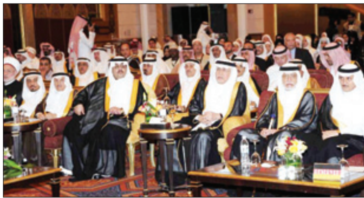
وزير الثقافة والإعلام وسمو مساعده مع الضيوف

جدة - سعد بن عبدالله احتفت وزارة الثقافة والإعلام مساء أمس في جدة بضيوفها المشاركين من مختلف الوسائل الإعلامية في تغطية ونقل شعائر حج هذا العام.