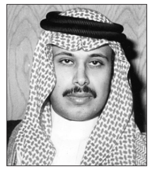
الأمير مشاري بن سعود

الباحة-واس ■ عبر صاحب السمو الملكي الأمير مشاري بن سعود بن عبدالعزيز أمير منطقة الباحة عن بالغ فرحته وابتهاجه أن من الله تعالى على خادم الحرمين الشريفين الملك عبدالله بن عبدالعزيز آل سعود / حفظه الله / بالشفاء والخروج من المستشفى على إثر العارض الصحي الذي ألم به. وقال سموه في تصريح لوكالة الأنباء السعودية // إن خروج خادم الحرمين الشريفين من المستشفى كان محل سعادة وفرحة عمت