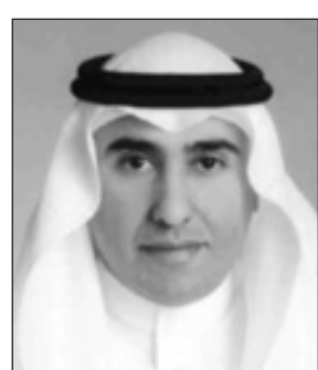
الدكتور هاني ابوراس

جدة-واس ■ رفع معالي أمين محافظة جدة الدكتور هاني بن محمد أبو راس أسمى آيات التبريكات لخادم الحرمين الشريفين الملك عبدالله بن عبدالعزيز آل سعود حفظه الله بمناسبة خروجه من المستشفى سالماً معافى، وأعرب معاليه في تصريح لوكالة الأنباء السعودية بهذه المناسبة عن سعادته واستبشاره كشأن الشعب السعودي بالبيان الذي صدر أمس الأول عن الديوان الملكي متضمناً خروج ملك البلاد المفدى من المستشفى معافى ببيان الله تعالى، وقال: "إن الفرحة الكبيرة بهذه الأنباء تعكس