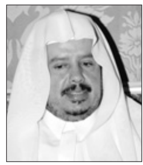
د.عبدالله آل الشيخ

الرياض-واس ■ عبر معالي رئيس مجلس الشورى الشيخ الدكتور عبدالله بن محمد بن إبراهيم آل الشيخ باسمه شخصياً ونيابة عن أعضاء المجلس ومنسوبيه عن مشاعر الفرح والسرور بمناسبة شفاء خادم الحرمين الشريفين الملك عبدالله بن عبدالعزيز آل سعود وخروجه - حفظه الله - من المستشفى بعد أن من الله عليه بالصحة والعافية. وقال معاليه في تصريح لوكالة الأنباء السعودية بهذه المناسبة // إن الله من علينا وأكرمنا برؤية خادم الحرمين الشريفين وهو يغادر المستشفى بصحة وعافية إلى مقر إقامته في نيويورك لقصاء فترة من النقاهة