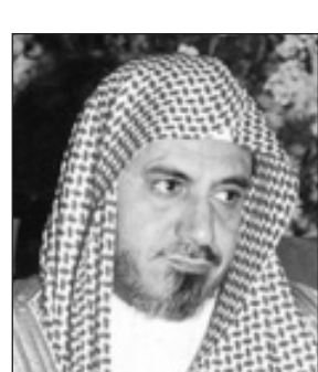
الدكتور صالح بن حميد

الرياض-واس ■ عبر معالي رئيس المجلس الأعلى للقضاء الشيخ الدكتور صالح بن عبدالله بن حميد عن سعادته بمناسبة خروج خادم الحرمين الشريفين الملك عبدالله بن عبدالعزيز آل سعود من المستشفى، وقال معاليه في تصريح لوكالة الأنباء السعودية: "بسم الله والصلاة والسلام على رسول الله وعلى آله وصحبه أجمعين، سرنا والله الحمد ظهور خادم الحرمين الشريفين بهذا