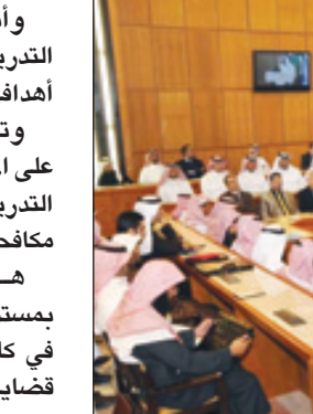
الاعمال الختامية للحلقة

وأبان أنه قد استقطبت للحلقة والدورة تدريبية هيئة علمية متميزة حتى تحقق أهدافها وغاياتها. وتم عقب ذلك توزيع الشهادات على المشاركين في الحلقة العلمية والدورة التدريبية استخدام الدليل الرقمي في مكافحة الجرائم الاقتصادية. وهذا وقد هدفت الحلقة الارتقاء بمستوى أداء رجال الأمن والقضاء في كافة المؤسسات المعنية بالتعامل مع قضايا إيذاء الأطفال ، واكساب المشاركين مهارات في مجال حقوق الطفل وحمايته ، وتبادل الخبرات والمعلومات فيما بين المشاركين ، وتنمية الثقافة الشرعية والقانونية لديهم.