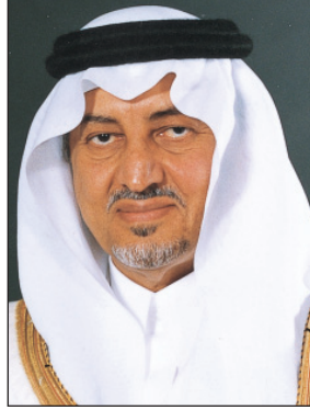
الأمير خالد الفيصل

مشيراً إلى أن هؤلاء الخريجين يعتبرون باكورة إنتاج الجامعة المهيئين لسوق العمل. وذكر بأن العدد الإجمالي للخريجين من مختلف الكليات والتخصصات ومختلف الدرجات العلمية ٧ آلاف وخمسة مائة وخمسة وخمسون خريج، مضيفاً إنهم يعتبرون الفخرة الأولى للجامعة منذ سنوات بهدف تأهيل خريجيها لسوق العمل مباشرة عبر إعادة الهيكلة للخطط الدراسية للعديد من الكليات مثل كلية الآداب والعلوم الإنسانية، الاقتصاد والإدارة وكذلك كلية العلوم. وأضاف أن من أهم ملامح الخطة التي وضعتها الجامعة للنهوض بمستوى أبنائها وجعلهم ينافسون في سوق العمل تكثيف اللغة الإنجليزية ومهارات الحاسب الآلي بالإضافة إلى ربطهم بسوق العمل من خلال تغطية جزء من المناهج لمتطلباته، فضلاً عن التركيز على التدريب العملي، لافتاً إلى أن كلية المجتمع أبرمت العديد من عقود العمل مع جهات مختلفة من القطاع الخاص لتوظيف خريجيها. وأكد عميد عمادة القبول والتسجيل على اهتمام الجامعة بالجانب العملي لدى الطلاب وتطوير مهاراتهم لسد الفجوة بين التعليم الجامعي ومتطلبات سوق العمل وفقاً لاستراتيجية الدولة في تنمية الوطن.