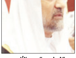
عبد العزيز بن صقر

أيمن البرادعي: دعوته الى حوار الأديان نموذج للانفتاح على الأخر وبناء عالم يخلو من الصراعات