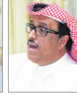
الفريق ضاحي خلفان تميم