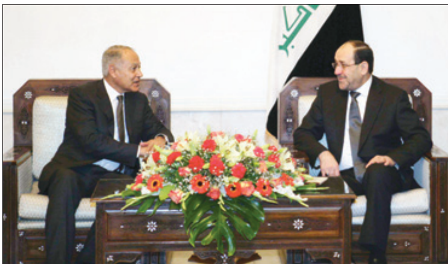
الملكى (يميناً) يستقبل دأبو الغيط، في مكتبه ببغداد

ووصل أبو الغيط صباح امس إلى بغداد والتقى عدداً من المسؤولين العراقيين على رأسهم رئيس الوزراء نوري المالكي ووزير الخارجية هوشيار زيباري.