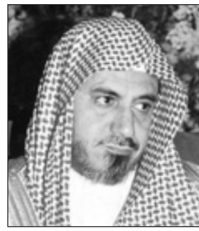
الدكتور صالح بن حميد

الرياض-واس ■ عبر معالي رئيس المجلس الأعلى للقضاء الشيخ الدكتور صالح بن عبدالله بن حميد عن سعادته بمناسبة خروج خادم الحرمين الشريفين الملك عبدالله بن عبدالعزيز آل سعود من المستشفى، وقال معاليه في تصريح لوكالة الأنباء السعودية: "بسم الله والصلاة والسلام على رسول الله وعلى آله وصحبه أجمعين، سرنا والله الحمد ظهور خادم الحرمين الشريفين بهذا