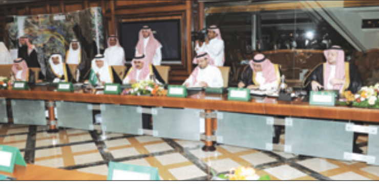
الأمير محمد بن نايف يترأس اجتماع المباحثات بين المملكة وأوزبكستان