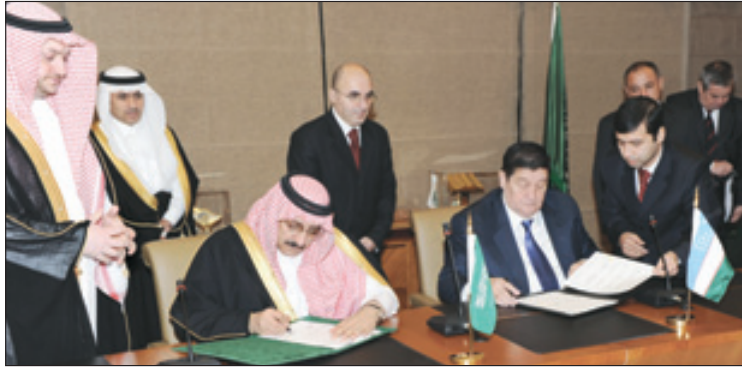
توقيع اتفاقية التعاون الأمني بين المملكة وأوزبكستان

الخطرة ، ومكافحة جرائم المعلوماتية ، ومكافحة جرائم الاتجار بالبشر ، إضافة إلى تبادل الخبرات والتجارب والمعلومات الأمنية بين البلدين الشقيقين. ثم أقام صاحب السمو الملكي الأمير محمد بن نايف بن عبدالعزيز مساعد وزير الداخلية للشؤون الأمنية حفل عشاء تكريماً لمعالي الضيف والوفد المرافق له. حضر جلسة المباحثات وتوقيع الاتفاقية الوفد السعودي الرسمي الذي يضم كلا من معالي وكيل وزارة الداخلية الدكتور احمد بن محمد السالم ، ومعالي المستشار الخاص لسمو مساعد وزير الداخلية للشؤون الأمنية الدكتور سعد بن خالد الجبري ، ومدير عام مكتب سمو