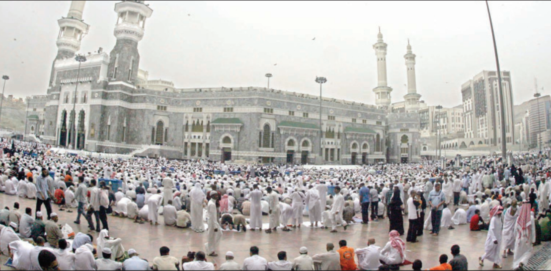
بانورامية للمساحات الخارجية للحرم.

مكة المكرمة - خالد عبدالله ■ تشهد مكة المكرمة اليوم ومع أول إجازة نهاية أسبوع في هذا الشهر المبارك توافد أعداد كبيرة من المعتمرين من داخل المملكة ومن خارجها لأداء مناسك العمرة وصلاة أول جمعة من هذا الشهر المبارك، حيث قامت كافة الجهات الحكومية بتوفير جميع الخدمات وتسخير كل الإمكانيات من أجل خدمة قاصدي بيت الله الحرام. ويتوقع أن يشهد حوالي المليون مصل اليوم صلاة أول جمعة من هذا الشهر الفضيل حيث من المتوقع أن تتكثف أروقة ومساحات المسجد الحرام والمساحات الشمالية منذ الساعات الأولى بجموع المصلين، حيث سيقوم رجال الأمن بالانتشار في جميع مداخل الطرق المؤدية إلى المسجد الحرام وتوجيه قائدي المركبات إلى المواقف المعدة في مداخل مكة المكرمة لإيقاف سياراتهم.