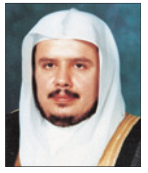
د.عبدالله ال الشيخ

بمبادرة سمو الأمير نايف بن عبدالعزيز الثاني رئيس مجلس الوزراء وزير الداخلية برفقة شكر معالي الدكتور أحمد محمد علي رئيس البنك الإسلامي للتنمية، لجهود البنك الطيبة في مساندة الدول الإسلامية الأعضاء، وذلك رداً على البرقية التي رفعها معاليه لسموه مصحوباً بالتقرير السنوي للبنك الإسلامي للتنمية لعام ١٤٣٠هـ (٢٠٠٩م).