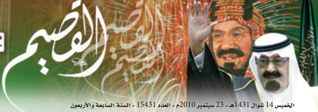
الخميس 14 شوال 1431 هـ - 23 سبتمبر 2010م - العدد 15431 - السنة السابعة والأربعون