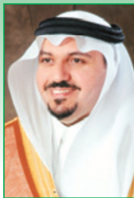
الأمير فيصل بن مشعل بن سعود

واليوم الوطني الذي تحفل به هذا اليوم هو يوم مجيد تتوالى معه الإنجازات الجبارة والكبيرة على مستوى وطننا الكبير منذ عهد المؤسس رحمه الله وواصل بعد المسيرة أبنائه الملك سعود و فيصل و خالد و فهد يرحمهم الله جميعاً حتى عهد النهضة الكبرى التي نعيشها في عهد سيدي خادم الحرمين الشريفين الملك عبدالله بن عبدالعزيز يحفظه الله يسأله عضده الأمين سيدي صاحب السمو الملكي الامير سلطان بن عبدالعزيز ولي العهد نائب رئيس مجلس الوزراء وزير الدفاع والطيران والمفتش العام.