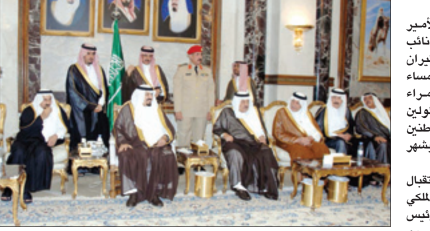
الأمير سلطان مستقبلاً الأمراء والمسؤولين وجمعاً من المواطنين (و.ا.س.)

بن عبدالعزيز آل سعود وصاحب السمو الأمير خالد بن عبدالله بن محمد وصاحب السمو الملكي الأمير عبدالعزيز بن خالد بن محمد وصاحب السمو الأمير خالد بن سعد وصاحب السمو الأمير خالد بن فهد بن خالد وصاحب السمو الملكي الأمير سعود بن عبدالعزيز وصاحب السمو الأمير فيصل بن مشعل بن عبدالعزيز وصاحب السمو الأمير بندر بن خالد بن فهد وصاحب السمو الملكي الأمير محمد عبدالله الفيصل وصاحب السمو الملكي الأمير محمد بن سعود بن عبدالعزيز مستشار وزير الداخلية وصاحب السمو الملكي الأمير مقرن بن عبدالعزيز رئيس الاستخبارات العامة وصاحب السمو الأمير فهد بن عبدالله بن محمد مساعد وزير الدفاع والطيران والمفتش العام للشؤون الطيران المدني.