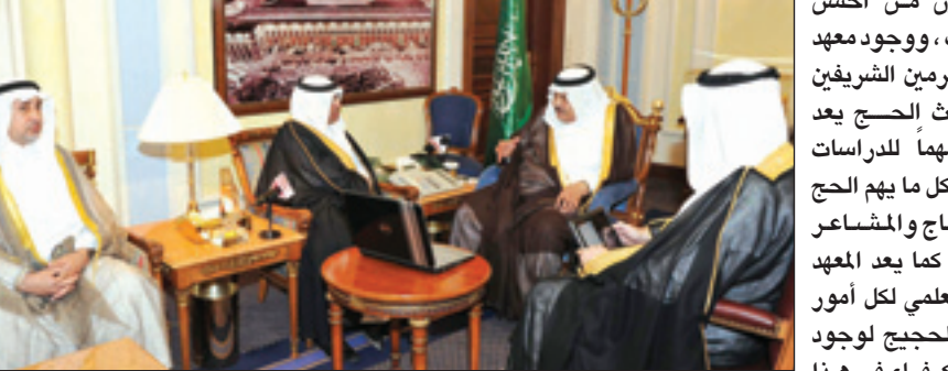
الأمير نايف يستقبل الدكتور عساس والدكتور الحربي ووفد جامعة أم القرى

الحج المستقبلية لسنوات طويلة. ثم عرض معاليه مجموعة من التقارير عن معهد خادم الحرمين الشريفين لأبحاث الحج خلال الفترة الماضية. بعد ذلك قدم عميد معهد خادم الحرمين الشريفين لأبحاث الحج نبذة عن المشاريع البحثية التي يقوم بها المعهد خلال الموسم الحالي في رمضان والاستعدادات لموسم حج هذا العام، وقدم نبذة عن الرؤية الإستراتيجية المقترحة للمعهد والتي تم تطويرها بالتعاون مع عدد من الخبراء المرموقين حول العالم. وفي نهاية الاستقبال شكر سمو الأمير نايف بن عبدالعزيز