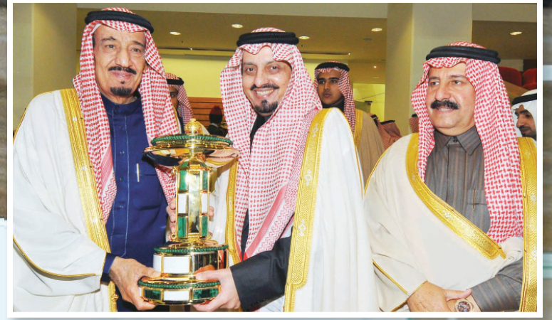
الأمير سلمان بن عبدالعزيز خلال رعايته لآخر بطولة على كأس الملك قبل أسبوعين وسلم فيها الكأس للأمير فيصل بن خالد «تصوير الفخاخ أحمدة»