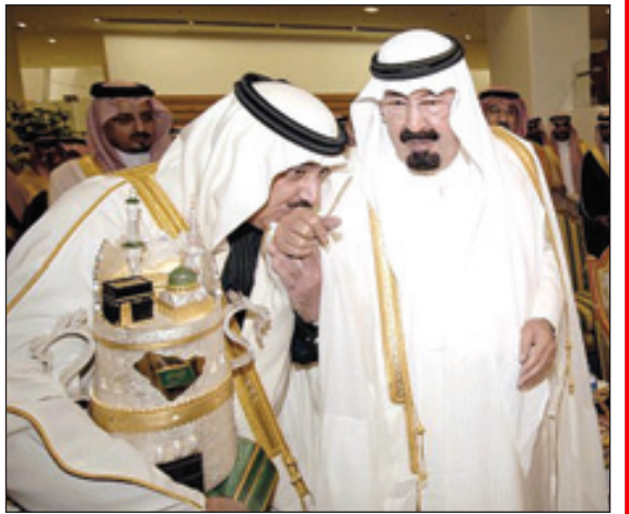
الأمير متعب بن عبدالله يقبل في والدة القائد بعد تتويجه بكأس الملك عبدالعزيز في آخر بطولة للأبيض الموسم قبل الماضي

نوه بدعم القيادة لرياضة الفروسية.. متعب بن عبدالله: كأس المؤسس تخليد للذكرى العظيمة للملك عبدالعزيز