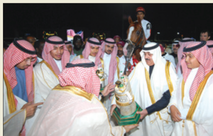
الأمير متعب بن عبدالله مع البطل «لله درك» بطل موسم ١٤٢٩ هـ

الكأس لأول مرة بثلاث مرات على التوالي. وفي عام ١٤٢٩ هـ كان موعد الفرح «الأبيض» مع المهر (لله درك). وفي الموسم الأخير تجلت فرس (الأزرق) بالمفاجأة الذهبية الكبرى حين أعادت (الأزرق) إلى ساحة البطولة في هذه المسابقة بعد خمسة مواسم من الغياب. وأدى هذا الفوز إلى قيام الاستطيل الأبيض بأبعاد الخيال الأرجنتيني (أبديل جاين) الذي كان على صهوة المهر (مستند) في ذلك السباق وكان المرشح الأقوى للظفر باللقب وتقدم الخيال بصورة مبكرة فكلفه ذلك إلغاء عقده وغيباه عن الميدان السعودي حتى اليوم!!