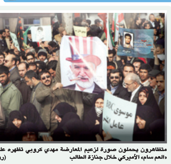
مظاهرون يحملون صورة لزعيم المعارضة مهدي كروبي تظهره على شكل «العم سام» الأميركي خلال جنازة الطالب

طهران - «الرياض» ووكالات الأنباء شهدت طهران أمس مواجهات بين مؤيدين للحكومة ومعارضين خلال تشييع جنازة طالب. وذكر موقع لهيئة الإذاعة الإيرانية «أن طلاباً وأشخاصاً يشاركون في تشييع جنازة الطالب الشهيد صانع جاله اشتبكوا مع عدد صغير ذي صلة فيما يبدو بحركة العصيان وأرغموه على المغادرة من خلال ترديد هتافات تطالب بالموث للمناقضين» وقتل جاله بالرصاص في تجمع للمعارضة