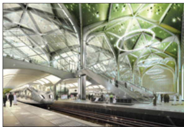
تصميم محطة المدينة المنورة من الداخل

الرياض - فكري العمري أعلن الدكتور جبارة الصريصري وزير النقل عن إنشاء أربع محطات ركاب لقطار الحرمين السريع بتكلفة تسعة مليارات ريال خلال عامين ونصف من بدء التنفيذ. وقال في مؤتمر صحافي أمس إنه وقع مع وزير المالية الدكتور إبراهيم العساف مؤخرًا أربعة عقود لبناء هذه المحطات. وأوضح أن توقيع العقود يمثل الجزء الثاني من المرحلة الأولى من مشروع قطار الحرمين السريع بهدف بناء أربع محطات للركاب في وسط مدينة جدة ومكة المكرمة والمدينة المنورة إضافة إلى محطة في رابغ تخدم مدينة الملك عبد الله الاقتصادية.