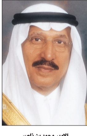
الأمير محمد بن ناصر

عن مشروع أنظمة نقل المياه من الشقيق إلى جازان. وعقب الحفل عبر سموه عن سعادته عن بتدشين المشروع واصفا المنجز بأنه أحد المنجزات التي يعمل خادم الحرمين الشريفين الملك عبدالله بن عبدالعزيز آل سعود وسمو ولي عهده الأمين وسمو النائب الثاني -حفظهم الله على توفيرها لأبنائهم المواطنين في مختلف المناطق وحلم من أحلام أهالي المنطقة جاء اليوم الذي أصبح فيه حقيقة ماثلة للعيان. وهنا سموه الأهالي بهذه المناسبة مشيراً إلى أن المشروع سيقف باحتياجات المواطن والمقيم بالمنطقة من المياه وذلك حسب خطة موضوعة قابلة للتوسع بحيث يشمل كافة المحافظات والمراكز والقرى عبر شبكات المياه القائمة والتي تحت التنفيذ. وتطرق في تصريحه لمصائر المياه المتوافرة بالمنطقة ومنها سد وادي بيش الذي يعد من أكبر السدود على مستوى المملكة ويستفيد منه في توفير مياه الشرب والزراعة سد وادي ضمد وسد وادي جازان الذي يجري حالياً استخراج الرواسب منه والاستفادة المثلثي من السد سائلاً الله تعالى أن يمد على هذه البلاد نعمة ظاهرة وباطنة وأمنها وولادة أمرها. واختتم سموه تصريحه مفيداً أن محافظة الدرب والشقيق ستكمن من ضمن المحافظات والمراكز التي ستستفيد من المشروع وستحظى بالعديد من المشروعات التنموية والخدمات الاجتماعية التي ستقدمها تحلية الشقيق للمواطن والمقيم بالمحافظة.