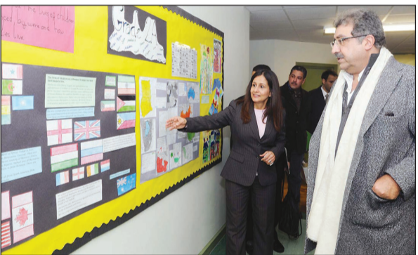
الأمير فيصل بن عبدالله خلال جولته في مرافق الأكاديمية