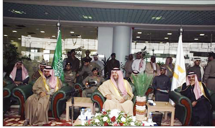
محافظ الخرج خلال الحفل

وبين الدكتور السديري أن أهداف الندوة تتمحور في تشجيع العمل الدعوي على