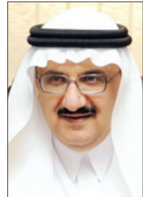
الأمير منصور بن متعب

الحرص على جمع المعلومات وتسجيلها في موقع ترغف الجهات الحكومية تقريراً خلال ٩٠ يوماً من الوزارة.