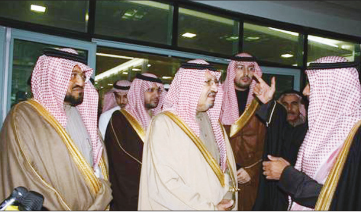
محافظ الخرج يستمع لشرح تفصيلي عن المشاريع