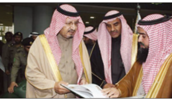
محافظ الخرج يتطلع على إصدارات الجامعة

بعد ذلك التقى وكيل الجامعة للدراسات العليا والبحث العلمي الدكتور عوض الاسمري تلاها كلمة وكيل الجامعة للشؤون التعليمية الدكتور صالح القحطاني ثم كلمة وكيل جامعة الخرج الدكتور عبدالرحمن الخضير.