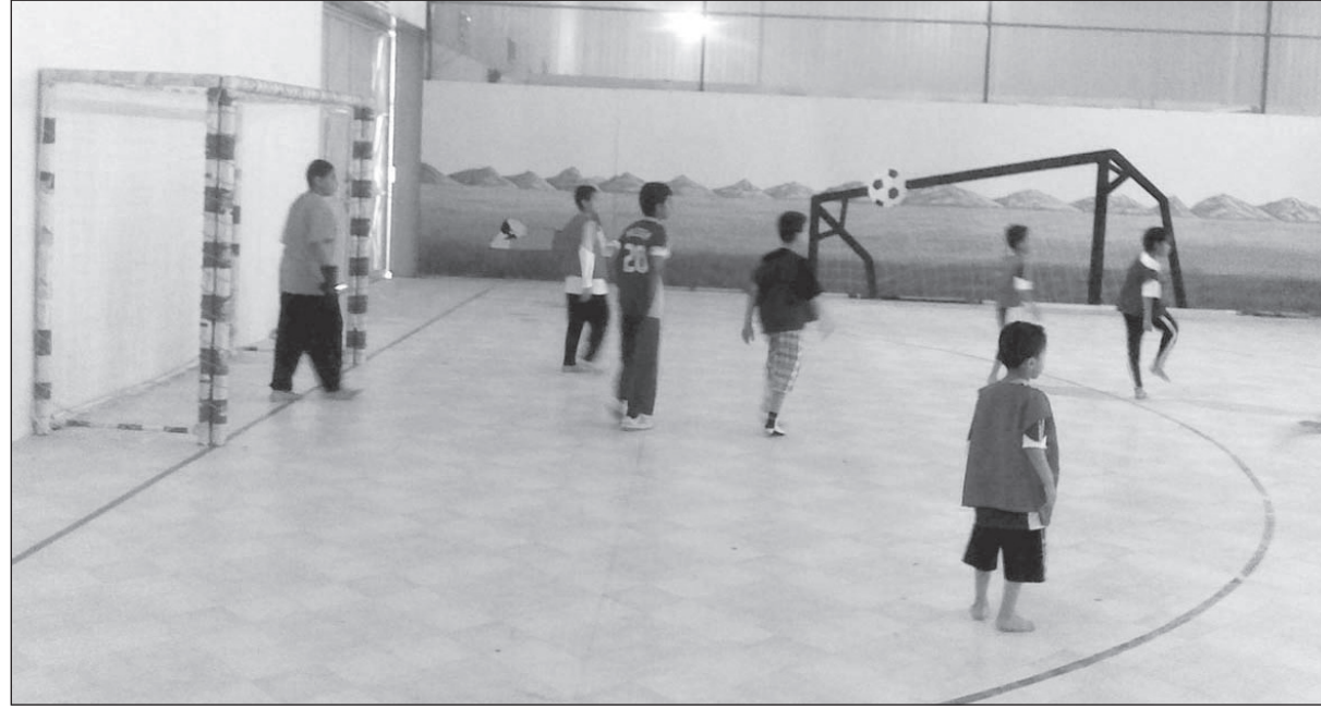
٣-ملاعب كرة القدم