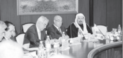
الشيخ خلال لقائه مع الملك عبدالله بن عبدالعزيز آل سعود